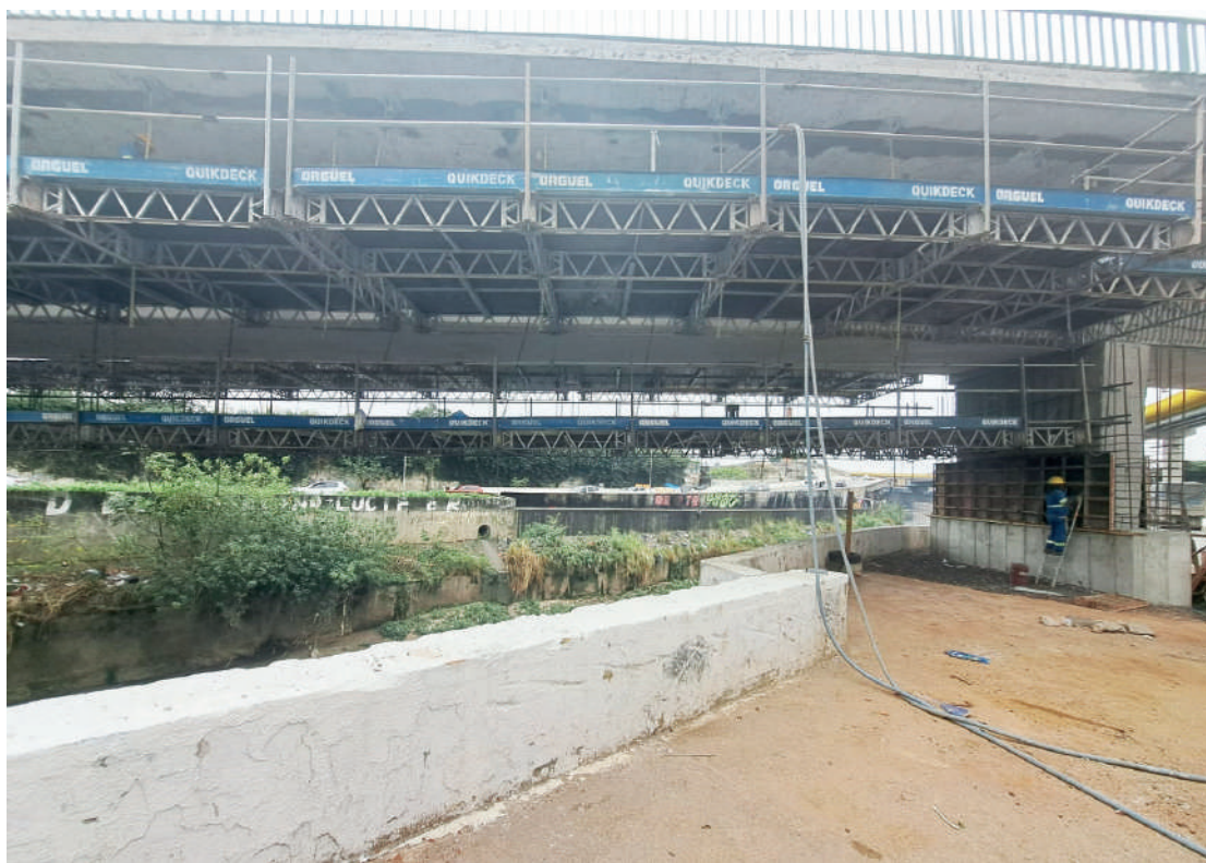
Prazo para entrega dos serviços, que antes era de 180 dias, deverá ser adiado até janeiro de 24

À frente de um dos maiores cronogramas de obras já estabelecidos na cidade, a Prefeitura de São Paulo iniciou o programa de recuperação e manutenção de pontes, viadutos, pontilhões, passarelas e túneis da capital. Com investimento de R$ 1,64 bilhão, a administração está trabalhando na recuperação de grandes estruturas