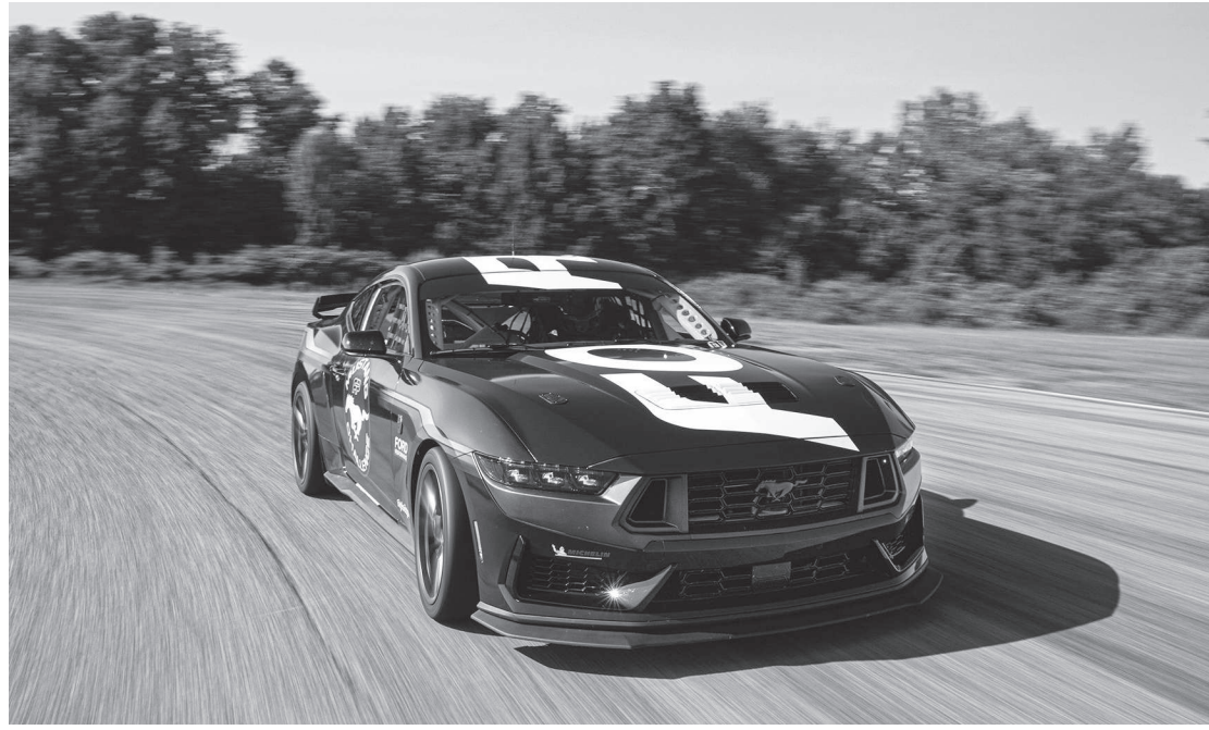
Veículo foi projetado apenas para uso nas pistas, com vários componentes com a versão de rua

Ele traz também vários equipamentos especiais para as pistas, como gaiola de proteção, bancos Recaro FIA, volante Sparco de liberação rápida, sistema de combate a incêndio, redes de segurança e célula de combustível. Tem ainda sistemas especiais de refrigeração de óleo, da transmissão, do diferencial e dos freios, escapamento de corrida Borla e suspensão ajustável com amortecedores Multimatic. As rodas são de 19"x10,5" na dianteira e 19"x11" na traseira, da Ford Performance, com pneus de corrida slick Michelin desenvolvidos especialmente para a Mustang Challenge.