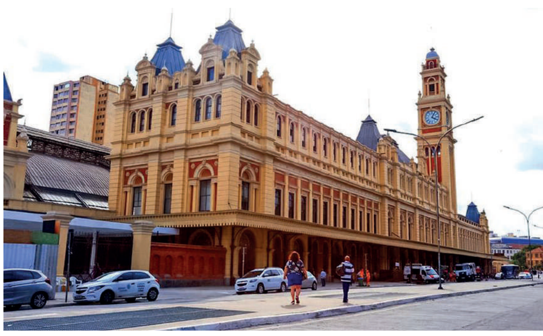
Ao longo dos próximos quatro meses, o público terá acesso à exposição Essa Nossa Canção

Já na exposição principal, o visitante pode conferir uma série de instalações interativas, como Português do Brasil e Palavras Cruzadas, que abordam a riqueza e diversidade da língua portuguesa. Um dos