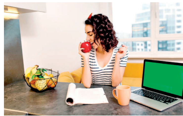
Alimentação é mais poderosa linha de defesa contra os radicais livres

Um dos processos mais prejudiciais ao organismo, relacionado ao consumo de açúcar, é a glicação. Trata-se de uma reação química em que moléculas de glicose se ligam a proteínas saudáveis, resultando na formação de AGEs (Produtos Finais de Glicação Avançada). Esses compostos comprometem a estrutura das proteínas, tornando-as menos eficazes em