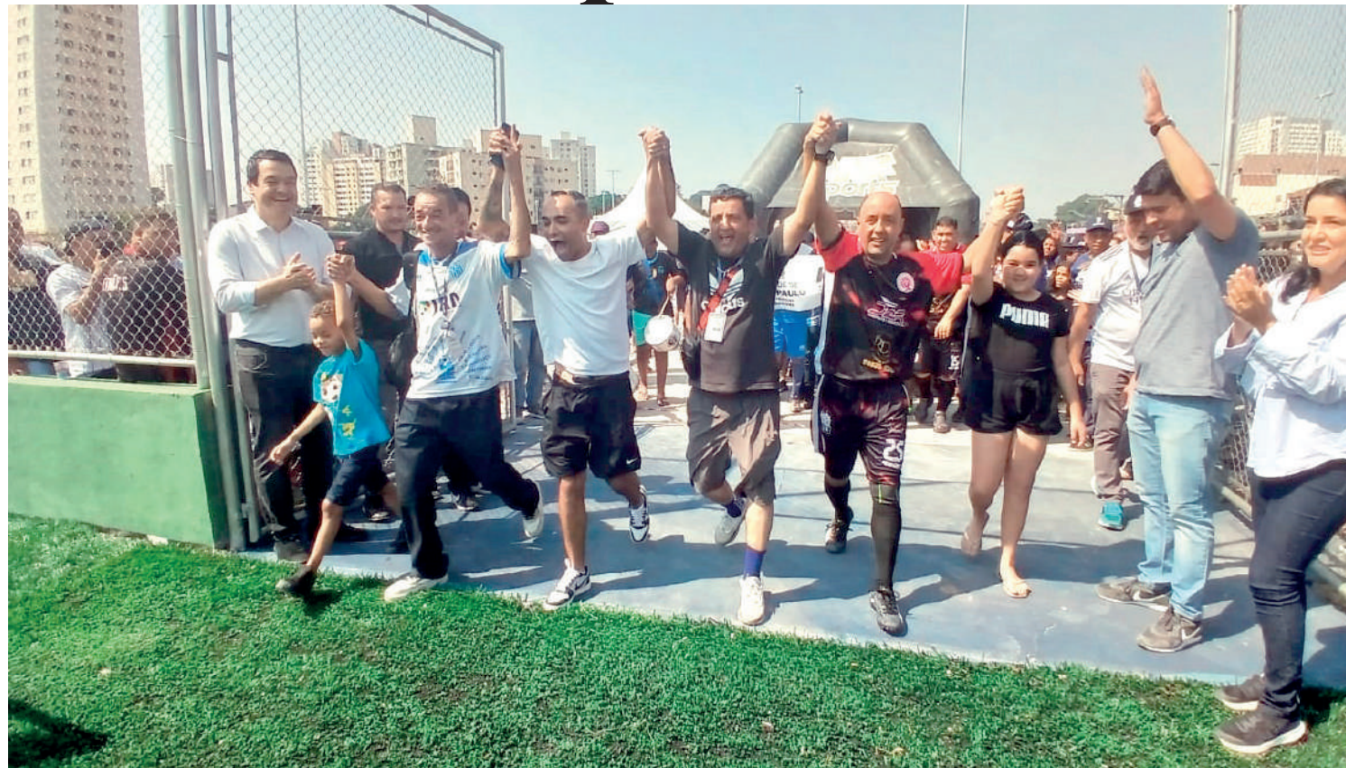
“Parque Esportivo Genaro de Carvalho”. Este é o nome da nova área de esportes e lazer, inaugurada na rua que leva o nome do espaço, localizada na região do Jabaquara. No sábado (17), um evento solene com autoridades e lideranças do bairro aconteceu para inauguração oficial do local. PÁGINA 5