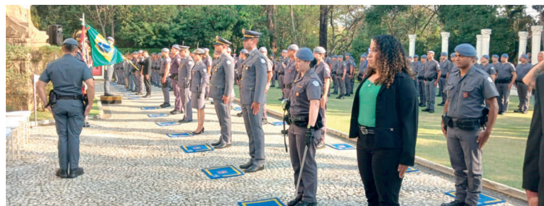
Cerimônia reuniu policiais militares da região nos jardins do histórico Palácio dos Cedros

Uma grande festa realizada no histórico Palácio dos Cedros celebrou os 50 anos do Comando de Policiamento de Área Metropolitana Dois, que está localizado na 17ª Delegacia, e é responsável por promover a segurança do Ipiranga e adjacências.