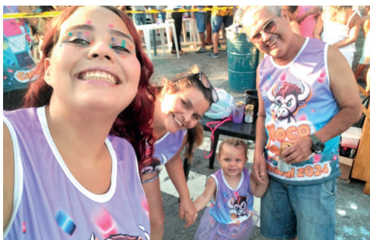
Bloco do Boi desfilou pela rua Izonoro animando os foliões