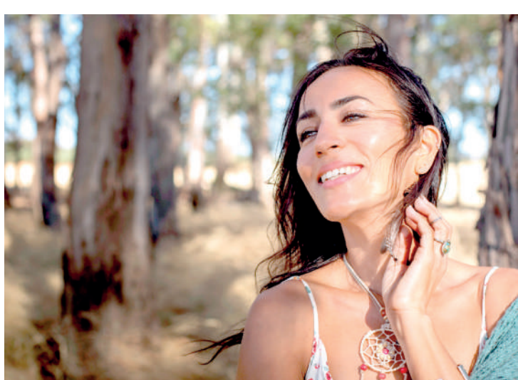
Cultivar o sorriso e uma postura otimista na vida é fundamental

É importante ressaltar que nenhum creme terá o efeito desejado se a saúde estiver comprometida, e os hormônios desempenham um papel importante nesse equilíbrio. A inevitável Tensão Pré-