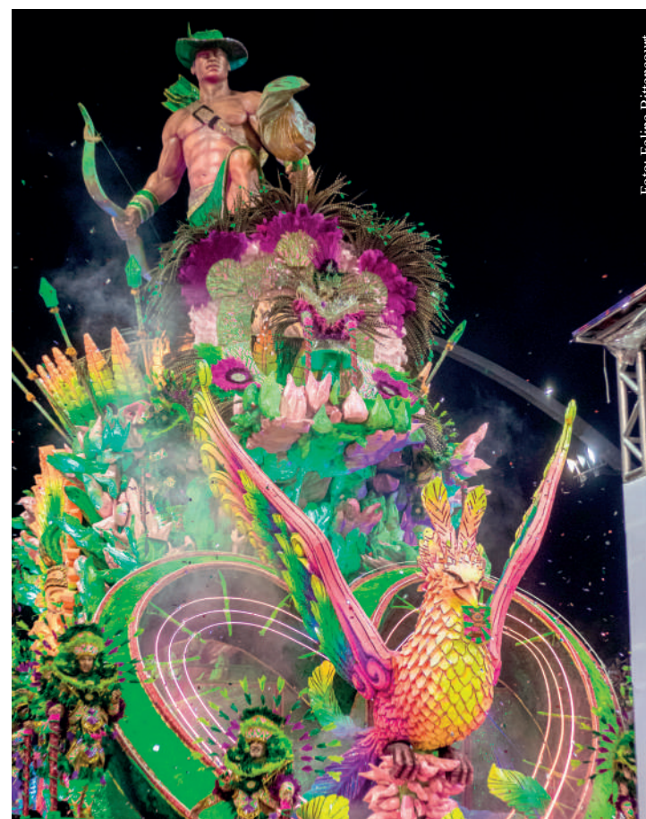
Escola fez bonito na avenida e ficou com “gostinho de quero mais”

Agora, a Barroca Zona Sul começará a se preparar para o Carnaval de 2025.