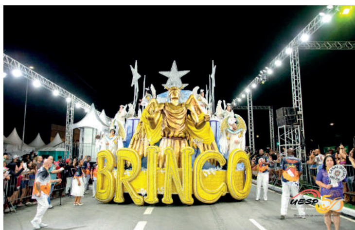
Com 269,9 pontos, escola conquistou o sonho de seus integrantes

“O primeiro sentimento: alívio! Aliviado. Segundo sentimento: o sabor da vitória, porque a nossa escola este ano, como todos nós sabemos, passou por