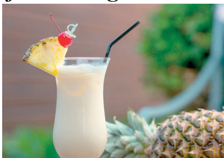
Versão do drink caribenho Piña Colada faz muito sucesso

Ingredientes: 75 ml de cachaça envelhecida; 100 ml de suco de abacaxi (pode usar também o purê da fruta ou a polpa congelada); 20 ml de melado de cana; 10 ml de suco de limão; 60 ml de leite de coco; 5 pedras de gelo. Preparo: Coloque todos os ingredientes na coqueteleira e bata vigorosamente. Despeje o drinque em um copo longo e sirva sem o gelo. Decore com um triângulo de abacaxi ou folhas da coroa na lateral do copo para caracterizar esta releitura da Piña Colada, um conhecido drinque com ares caribenhos.