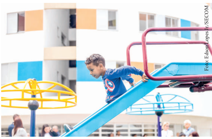
Convênio para a entrega de mais 120 unidades já foi assinado

O projeto favorece a ventilação nos espaços internos – o que atenua a sensação térmica em relação ao ambiente externo – e