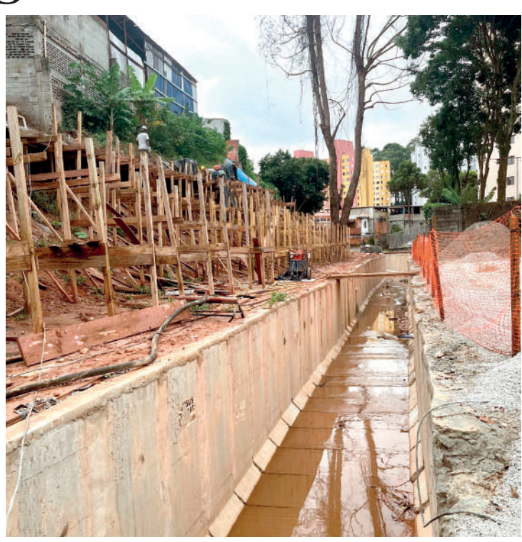
Foram investidos R$ 16 milhões, de acordo com a Prefeitura de SP