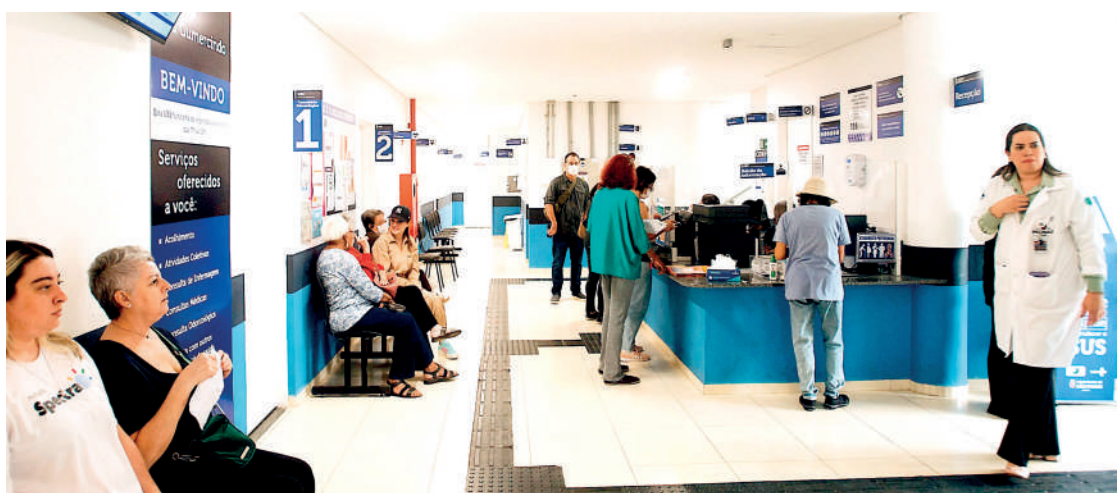
Unidade dispõe de psiquiatras, pediatras, nutricionistas, ginecologistas, cirurgiões dentistas e enfermeiros

Durante o evento, o prefeito Ricardo Nunes enfatizou a importância do trabalho conjunto com o Governo estadual. “A parceria entre a Prefeitura e o Estado tem sido muito produtiva. O Estado passou esse terreno para nós e possibilitou que pudéssemos fazer as reformas. Estamos com essa UBS maravilhosa, que é uma unidade de modelo de atenção integral, com atendimento de clínica-médica, generalista, pediatra, ginecologia, psiquiatria e saúde bucal”, disse o prefeito.