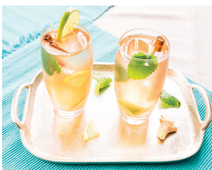
Opte por tomar um delicioso chá gelado de gengibre com hortelã

Além do gengibre, canela e pimenta, outros alimentos também prometem auxiliar na eliminação da gordura do organismo e são mais fáceis de ingerir do que a pimenta, por exemplo. Entre eles estão rabanete, nabo, couve-flor, repolho, abobrinha, chicória, agrião, espinafre, melancia, melão, limão, amora, salmão, sardinha fresca e semente de linhaça ou farinha de linhaça. E falando em linhaça, há quem reclame deste poderoso alimento, rico em Ômega 3, quanto à forma de ingestão. Uma boa maneira é acrescentar 1 colher (sopa) ao dia ao almoço, como se fosse farofa. A farinha de linhaça mistura-se muito bem ao arroz ou à salada.