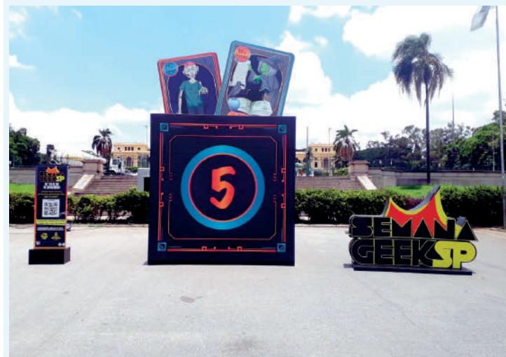
Palco Mundo Geek receberá Thiago Abravanel no sábado (25)

O Parque da Independência receberá, neste final de semana (25 e 26), o Palco Mundo Geek com grandes shows da primeira edição da Semana Geek. No sábado (25) e domingo (26), das 10h às 18h, haverá a apresentação do DJ Lucio de Souza. No sábado, também das 18h30 às 19h30, haverá apresentação do ator e cantor, Thiago Abravanel.