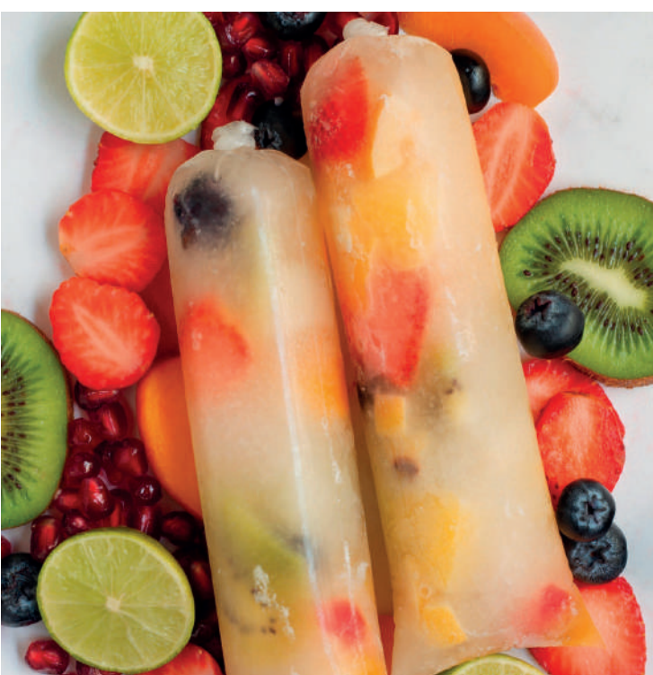
Temperaturas subindo! Que tal um geladinho para fazer em casa!

Ingredientes: 1 xícara (chá) de água de coco; meia xícara (chá) de suco de uva branco integral; 1 fatia grossa de abacaxi em pedaços pequenos; meia xícara (chá) de uvas roxas sem sementes; 1 kiwi picado; 6 morangos cortados ao meio. Preparo: Numa tigela, misture a água de coco e o suco de uvas. Reserve. Divida as frutas em porções à gosto e coloque nos saquinhos para geladinhos, preenchendo 2/3 da capacidade. Complete com a mistura de sucos. Amarre a ponta dos saquinhos e leve ao congelador. Sirva congelado.