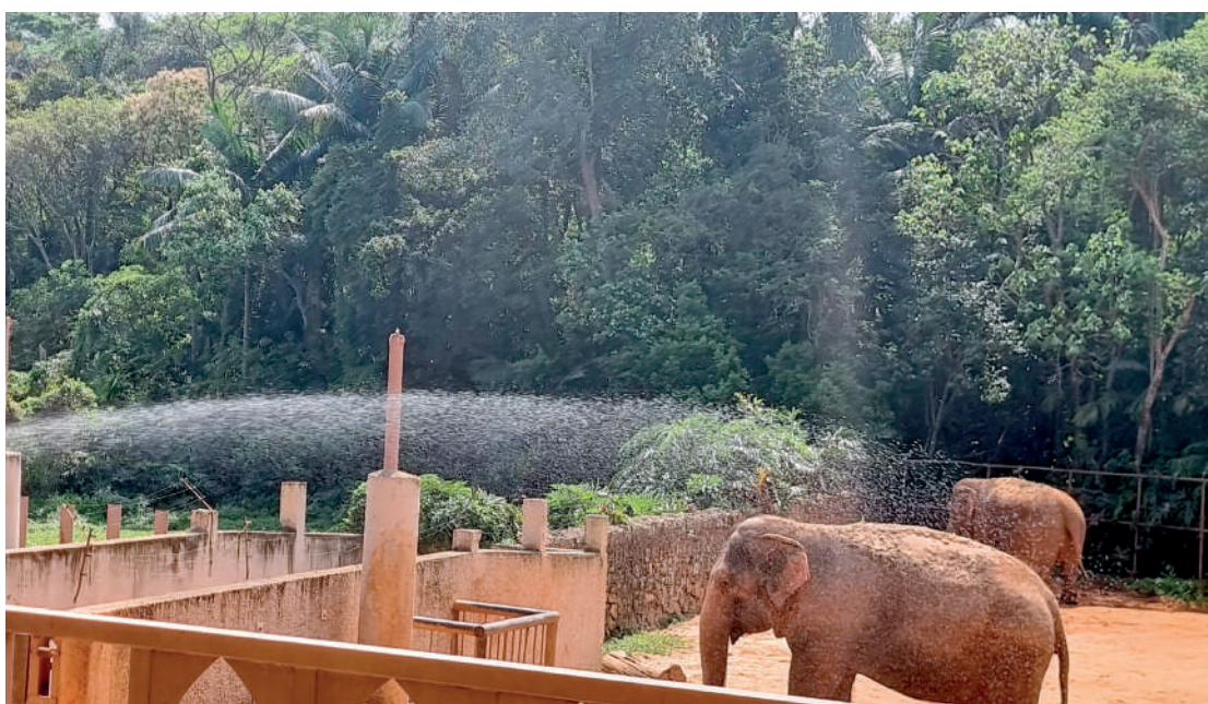
Elefante recebe banho de mangueira para se refrescar e se hidratar nos dias mais quentes do ano