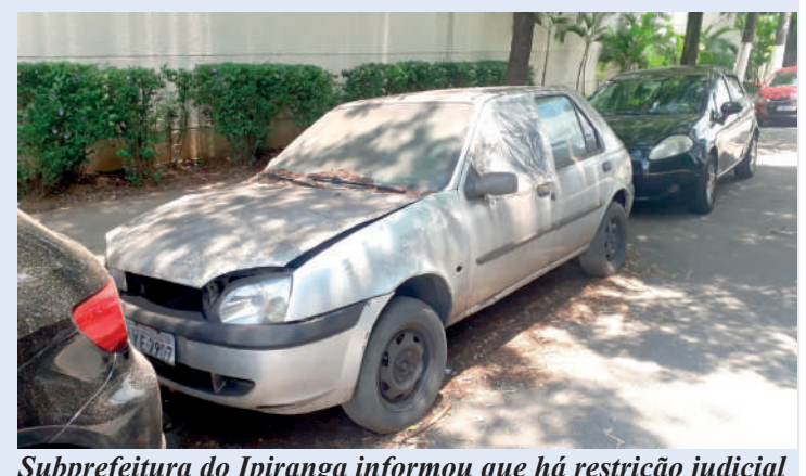
Subprefeitura do Ipiranga informou que há restrição judicial

Quem abandona automóveis está sujeito a multa de R$ 19.203,07, além dos custos de estadia e remoção do pátio, os quais serão arcados pelo proprietário do veículo, conforme informações da Secretaria Municipal das Subprefeituras.