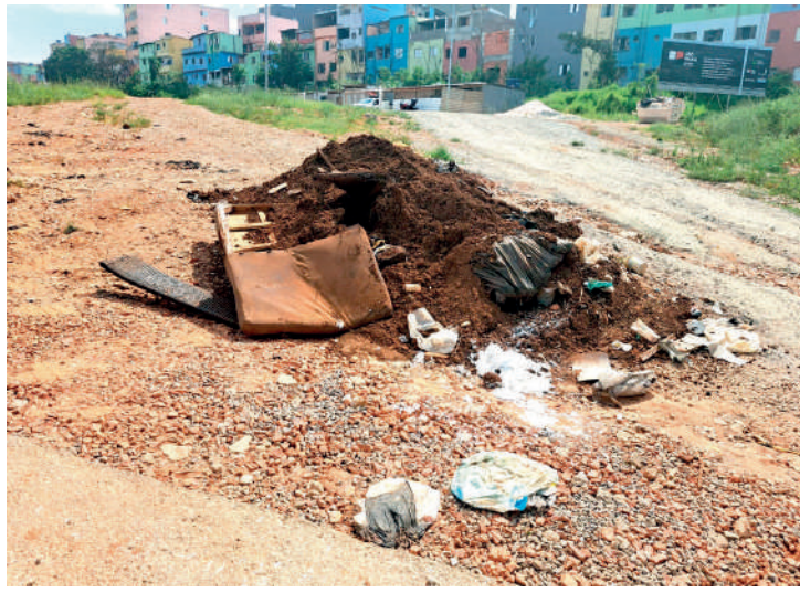
Estado de abandono no local causa desgosto aos moradores

Obras de muros e arrimos, entre outras, também foram realizadas pela companhia de concessão. Além disso, no decorrer do projeto, edificações para atividades votadas à cultura e qualificação profissio-