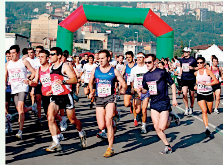
Serão disputadas 11 modalidades em grupo e individuais