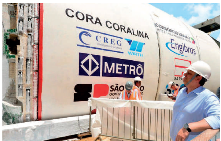
Máquina recebeu o nome da escritora Cora Coralina

O tatuzão, batizado de “Cora Carolina”, vai dar início a escavação do novo trecho de 8,4 km entre a Vila Prudente e a Penha. Nesta terça-feira (21) o governador Tarcísio de Freitas visitou as obras de expansão da Linha 2-Verde do Metrô, para conhecer a maior máquina deste tipo em utilização na América Latina. O novo trecho a ser escavado vai cruzar a zona leste de São Paulo em oito futuras estações e investimento de R$ 11,4 bilhões.