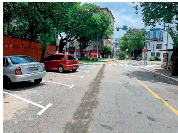
Cruzamento era conhecido por batidas frequentes de veículos

A partir de agora, os motoristas que atualmente acessam a Rua Leais Paulistanos