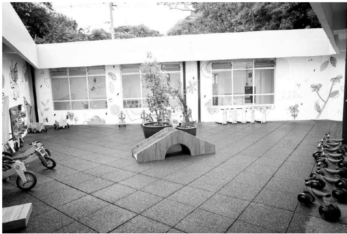
As vagas serão para crianças de 0 a 3 anos e destinadas à toda a comunidade da região

Presidente da Assembleia Legislativa de São Paulo, André do Prado, exaltou a importância da parceria com a Prefeitura de São Paulo para atender a demanda dos moradores da região e dos funcionários da Alesp. “Somos muito gratos pois isso é uma necessidade que nós temos”, disse. “Nossa gratidão pela sua par-