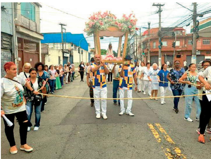
Evento religioso acontece há 15 anos e traz para São Paulo uma cultura de Belém do Pará: o Círio de Nossa Senhora de Nazaré