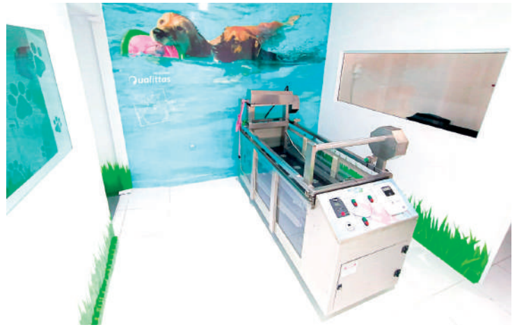
Faculdade Qualittas completa 21 anos de ensino de qualidade

Além da tradição, a instituição conta com cursos de pós-graduação exclusivos para os alunos de Veterinária.