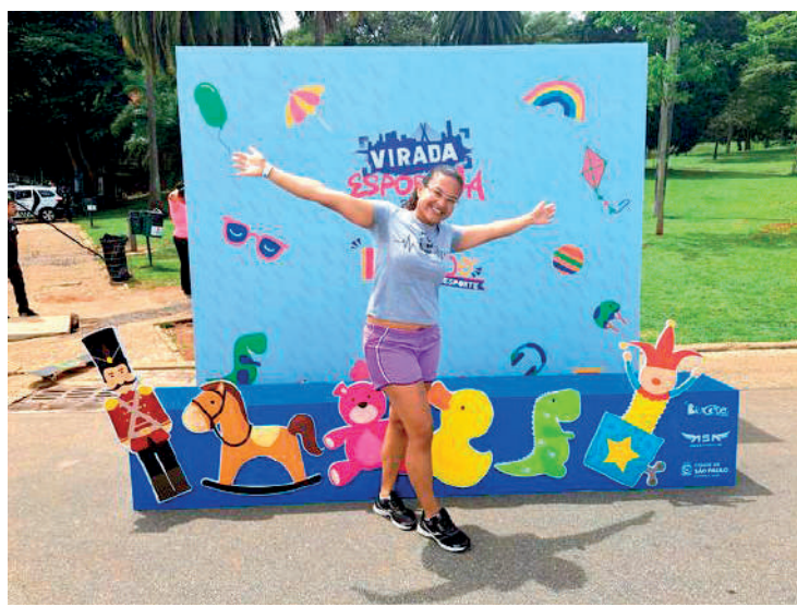
Virada Esportiva foi realizada pela Prefeitura no final de semana e apresentou uma edição especial do projeto “Bricando com o Esporte”