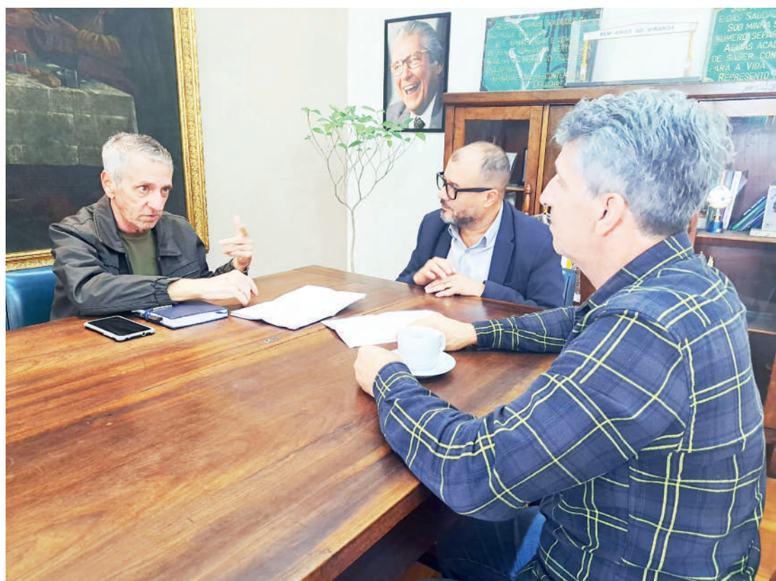
Desesperada, a vizinhança elaborou um abaixo assinado, o qual foi entregue ao Subprefeito