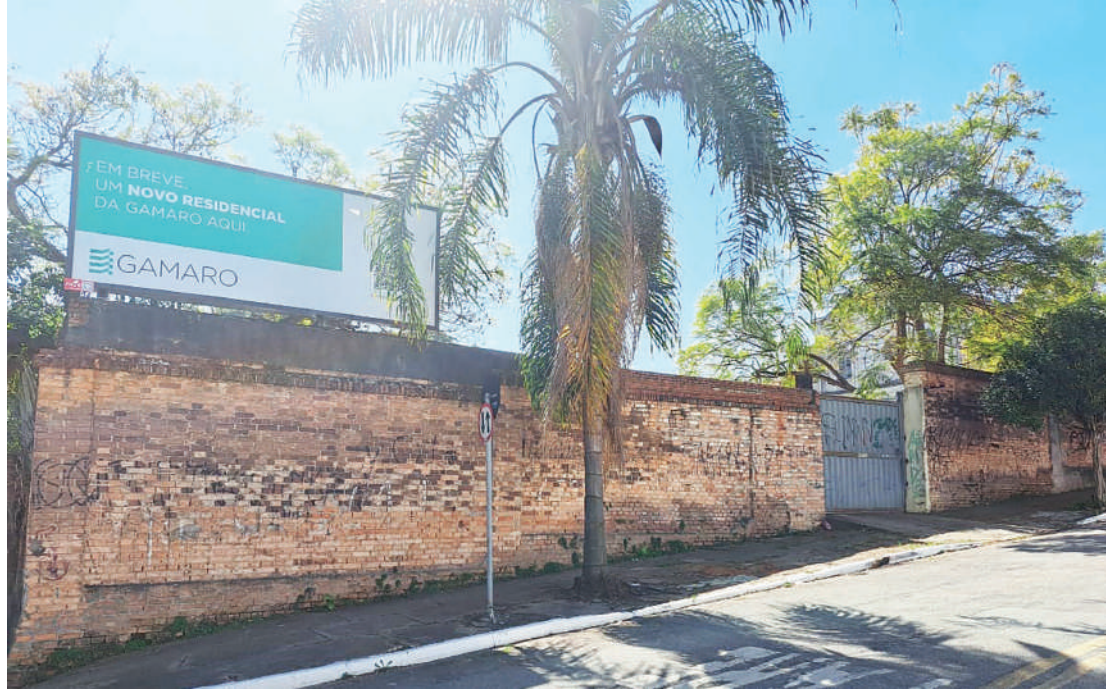
De acordo com informações da empresa, 74 árvores deverão ser replantadas no local

Em relação ao projeto o diretor afirmou que a ideia é construir um condomínio no com 43 casas assobradadas, de 130 a 260 metros. Tal informação, confronta a ideia pré-existente de que um prédio seria erguido ali. “A gente pretende fazer um projeto muito harmonioso com o entorno e com o bairro”, frisa ele.