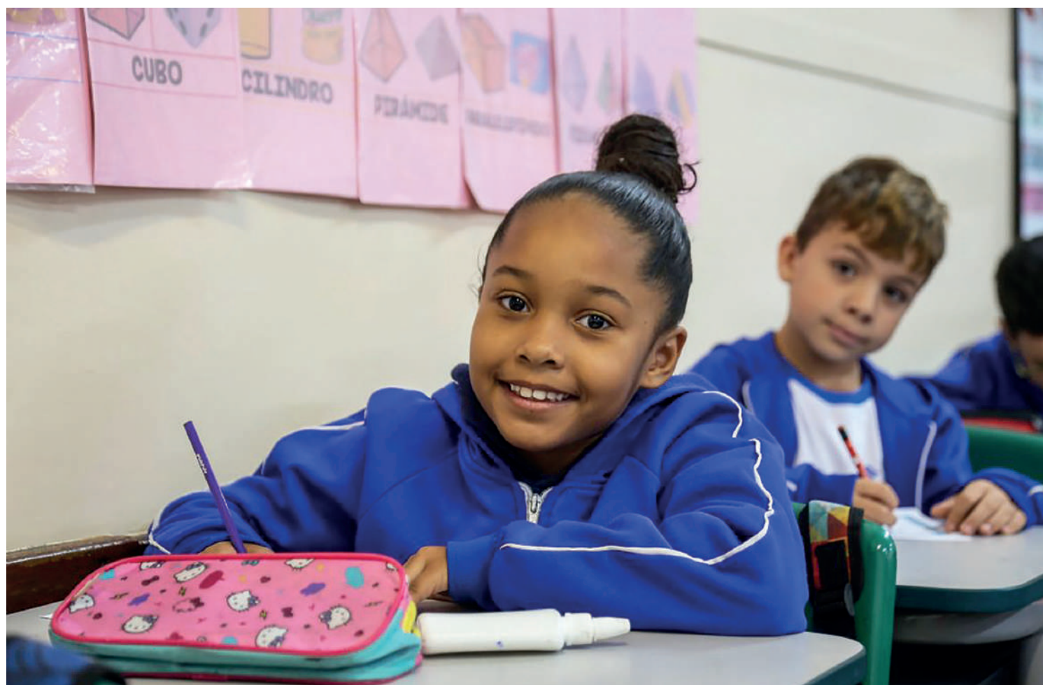
Os moradores de edifícios da Dom Pedro I, que estão no entorno de uma casa noturna, não aguentam mais a importunação, durante a madrugada, com batidas estridentes que chegam a estremecer as janelas dos apartamentos, de acordo com informações dos munícipes, por conta da falta de acústica do lugar. PÁGINA 3