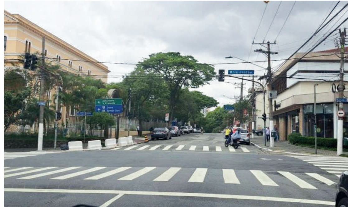
Alguns semáforos chegam a ficar semanas sem funcionar, em diferentes localidades do bairro