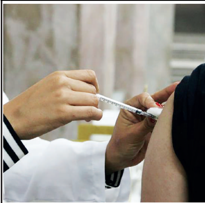
Mortes pelo vírus, tem queda de 57% de acordo com a OMS

Cerca de 1,5 milhão de novos casos de covid-19 foram registrados em todo o mundo entre 10 de julho e 6 de agosto – um aumento de 80% em relação ao período anterior. Durante os mesmos 28 dias, o vírus causou ainda 2,5 mil mortes – uma queda de 57% em relação ao período anterior. Os dados são da Organização Mundial da Saúde (OMS).