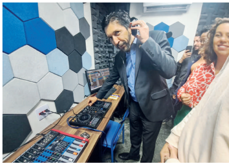
Equipamento ofertará cursos de som, imagem e audiovisual

Presente no evento de inauguração, o prefeito de São Paulo, Ricardo Nunes, apontou