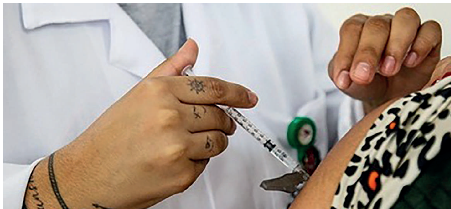
Cerca de 1,5 milhão de novos casos de covid-19 foram registrados em todo o mundo entre 10 de julho e 6 de agosto – um aumento de 80% em relação ao período anterior. Durante os mesmos 28 dias, o vírus causou ainda 2,5 mil mortes – uma queda de 57% em relação ao período anterior. Os dados são da Organização Mundial da Saúde (OMS). PÁGINA 2