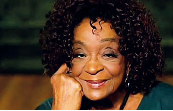
Léa (foto) foi convidada para trabalhar na Rede Globo em 76

A atriz Léa Garcia, de 90 anos, morreu nesta terça-feira (15), na cidade de Gramado, no Rio Grande do Sul, onde seria homenageada hoje com o troféu Oscarito, a mais tradicional honraria concedida, desde 1990, pelo Festival de Cinema da cidade. A morte foi divulgada na conta oficial da atriz no Instagram, que não informou a causa da morte.