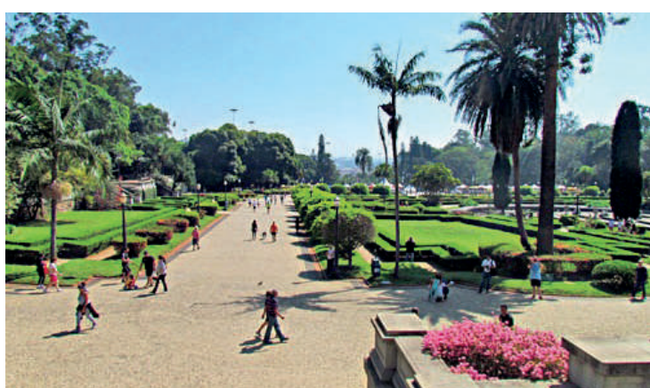
A contagem do público começou a ser feita em julho de 2020

Após o fechamento das áreas verdes, determinado em março de 2020 pelo prefeito Bruno Covas (1980-2021), os espaços retornaram com medidas preventivas e restrições que visaram conter o avanço da pandemia. Na história de São Paulo essa foi a primeira vez