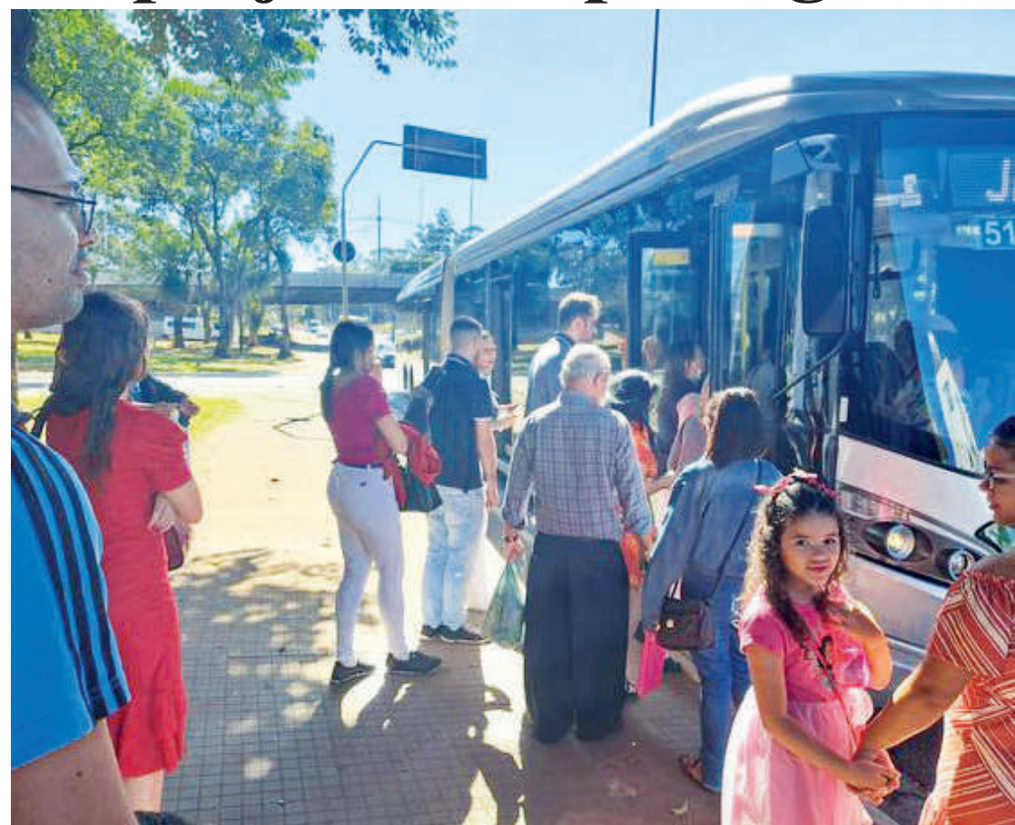
Transtornos devem acontecer até agosto, mês previsto para o término dos serviços no local

Em nota ao Jornal Ipiranga News, a Siurb informou que “empenha todos os esforços para devolver a estrutura aos passageiros na maior brevidade possível, e com total segurança”, mas não anunciou qualquer iniciativa para proteger os passageiros da chuva.