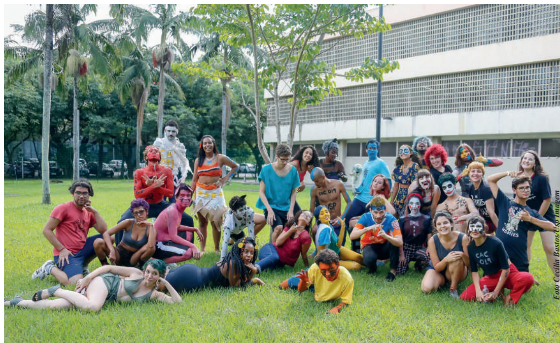
Calouros da USP são recebidos no Campus por veteranos com festa no primeiro dia de aula

Além da USP, outras três instituições brasileiras ficaram entre as 500 melhores do mundo: a Universidade Estadual de Campinas (Unicamp), que ficou na 220ª posição, seguida da Universidade Federal