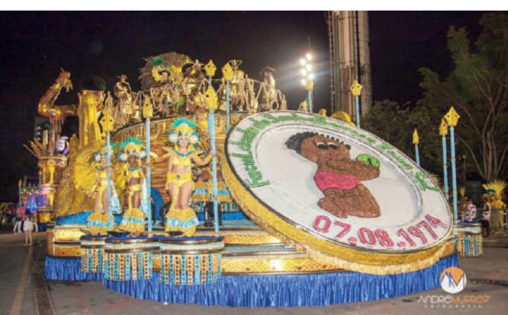
Sorteio foi realizado pela Liga das Escolas de Samba

Definida na segunda-feira (19), a ordem dos desfiles do Carnaval de 2024 já foi divulgada pela Prefeitura de São Paulo e a Barroca Zona Sul será a segunda escola a desfilarem no primeiro dia de desfile, que acontecerá dia 9 de fevereiro (sexta-feira). O sorteio foi re-