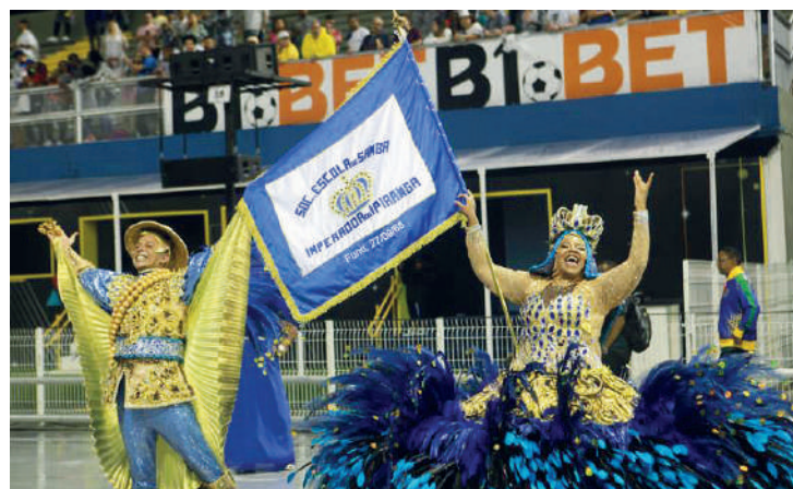
Escola deverá evitar erros para conseguir o sonhado acesso

O calendário com as datas nas quais as escolas de samba irão desfilarem no Carnaval de 2024 já foi divulgado pela Prefeitura de São Paulo. A Imperador do Ipiranga desfilará às 02h40 do dia 3 de fevereiro (sábado) pelo Grupo de Acesso 2.