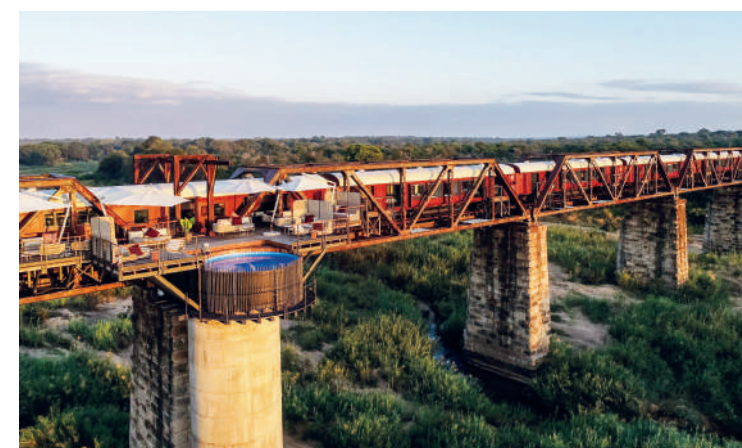
Este trem fica estacionado permanentemente na Ponte Selati

Com autênticos vagões Pullman transformados, esse exclusivo B&B (Em tradução literal, "Bed and Breakfast" – ou seja, "cama e café da manhã"), está localizado na antiga Estação Ferroviária de Petworth, no Reino Unido, construída em 1892, no Parque Nacional de South Downs. Ali, os hóspedes são recebidos no edifício restaurado da estação, construído na época vitoriana, e passam a noite em um vagão de trem histórico, agora com design moderno em seu interior. Se o tempo estiver bom, os hóspedes podem começar o dia com um café da manhã na plataforma da estação. Em seguida, podem visitar a cidade mercantil de Petworth ou desfrutar de uma viagem de 20 minutos pela zona rural britânica para conhecer o Castelo de Amberley. Ele