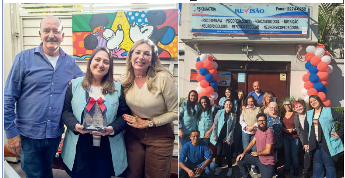
Reconhecimento e homenagens aos 11 anos da Clínica contou com a presença dos fundadores

A Unidade II da Clínica Revisão Psicologia, empresa que atua no mercado desde 1996 com foco principal voltado ao ser humano, completa 11 anos de existência. Atualmente, com 68 prestadores de serviços, o empreendimento busca crescer continuamente.