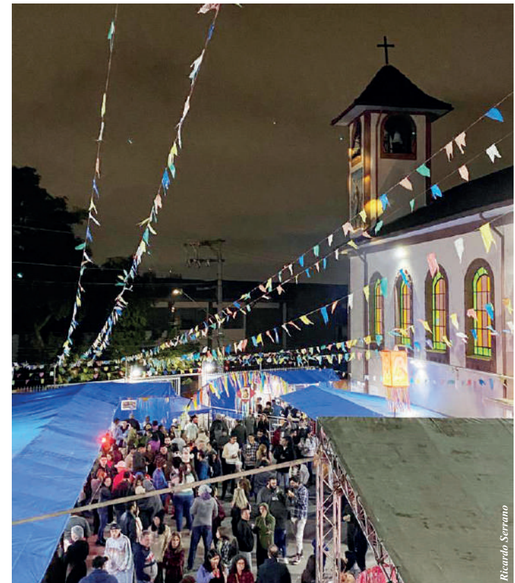
Festa continua nos dias 24 e 25 de junho e 01 e 02 de julho; evento também comemora os 60 anos da Igreja

As festas juninas estão movimentando a cidade. Igrejas, escolas e clubes promovem suas comemorações sempre atraindo um grande público. Na região do Jabaquara, A Paróquia São João Batista, no último fim de semana (dias 17 e 18) inaugurou suas festividades com muita música, comidas típicas da época e barracas de brincadeira para as crianças e adultos. Nesse ano, a festa tem um significado especial para os devotos, já que a paróquia está completando 60 anos. Vinho quente, quentão, milho verde, pastéis, sanduiches de "carne-louca", cachorro quente, churrasco, pizza e sucos naturais são algumas das comidas oferecidas nas barracas. Quem perdeu, ainda pode comparecer nos próximos finais de semana. PÁGINA 2