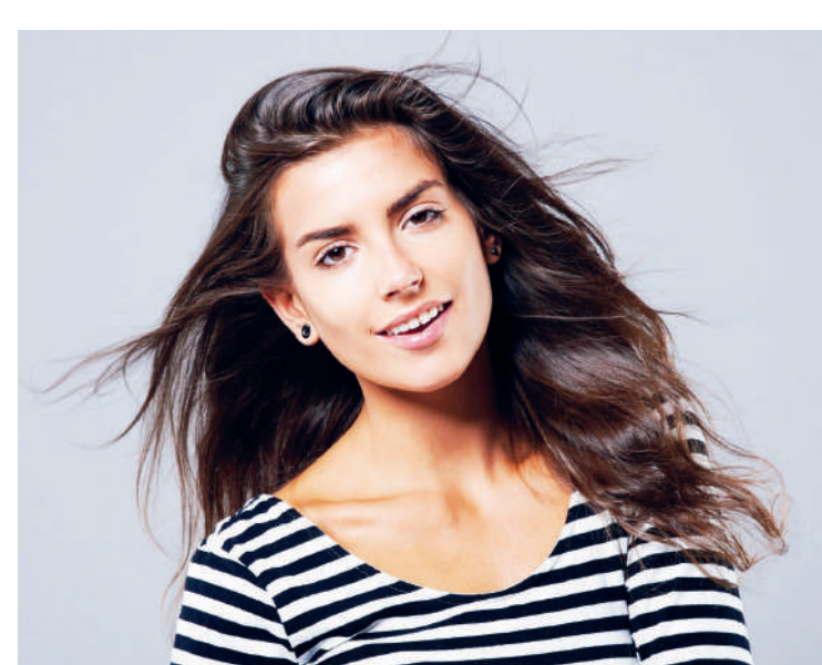
Use e abuse das manteigas formuladas a partir das frutas

O que ninguém poderia imaginar é que frutas como abacate, cacau e manga poderiam virar poderosas manteigas hidratantes dos cabelos. Fios desbotados, excesso de química, desidratação e ressecamento são os resultados que o verão deixou nos cabelos, sejam eles louros, morenos, crespos ou lisos; secos ou oleosos. Para tratá-los o jeito é recorrer aos cremes hidratantes e restauradores, sendo que sempre tem novidades na área.