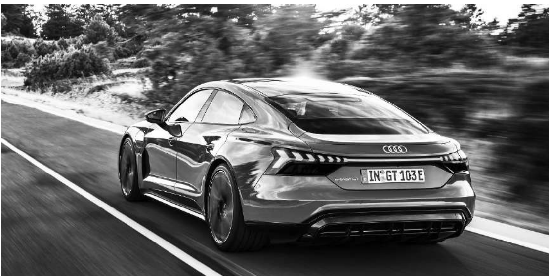
Novo modelo do e-tron GT exibe o design consagrado que destaca sua esportividade

Por dentro, a cabine do Audi e-tron GT proporciona uma atmosfera de monoposto, com posição baixa de assento, painel de instrumentos