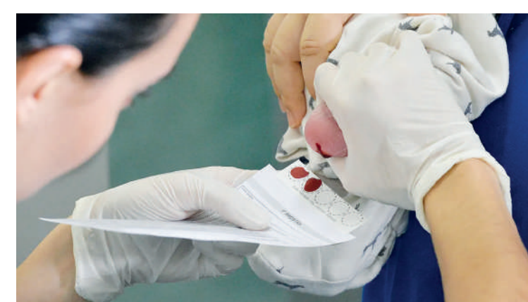
Teste é de extrema importância para qualidade de vida infantil

A gestão municipal mantém um contrato com o Instituto Jô Clemente (IJC), que oferece serviços de laboratório e triagem neonatal para as crianças que nascem nas maternidades da rede municipal e é responsável pela capacitação e sensibilização contínua de to-