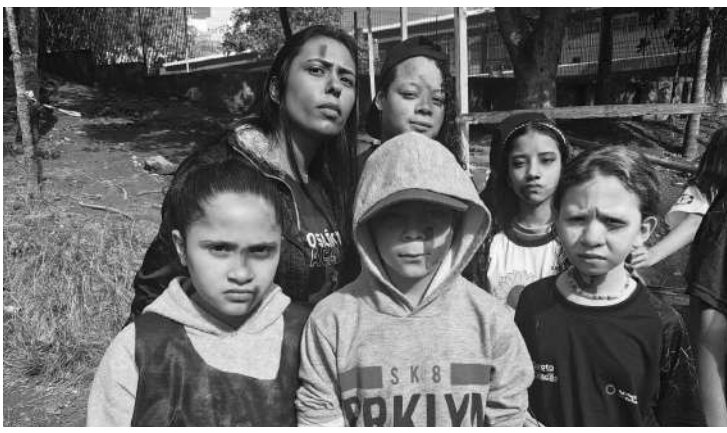
Crianças encenam a temática do feminicídio durante o evento