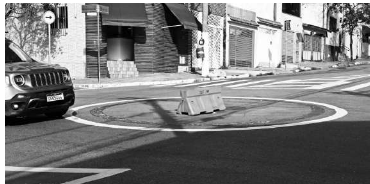
CET cobra a Sabesp para que a sinalização seja repostada

Não faz muito tempo, o Jornal Ipiranga News noticiou sobre a "nova rotatória" no cruzamento entre as ruas Cipriano Barata e Lord Cokrane, com tamanho significativamente reduzido, ocasionando acidentes e transtornos para os moradores da região. E a falta de sinalização, ainda na Cipriano, entre as ruas Almirante Lobo e mais à frente na rua Cisplatina, está deixando todos preocupados.