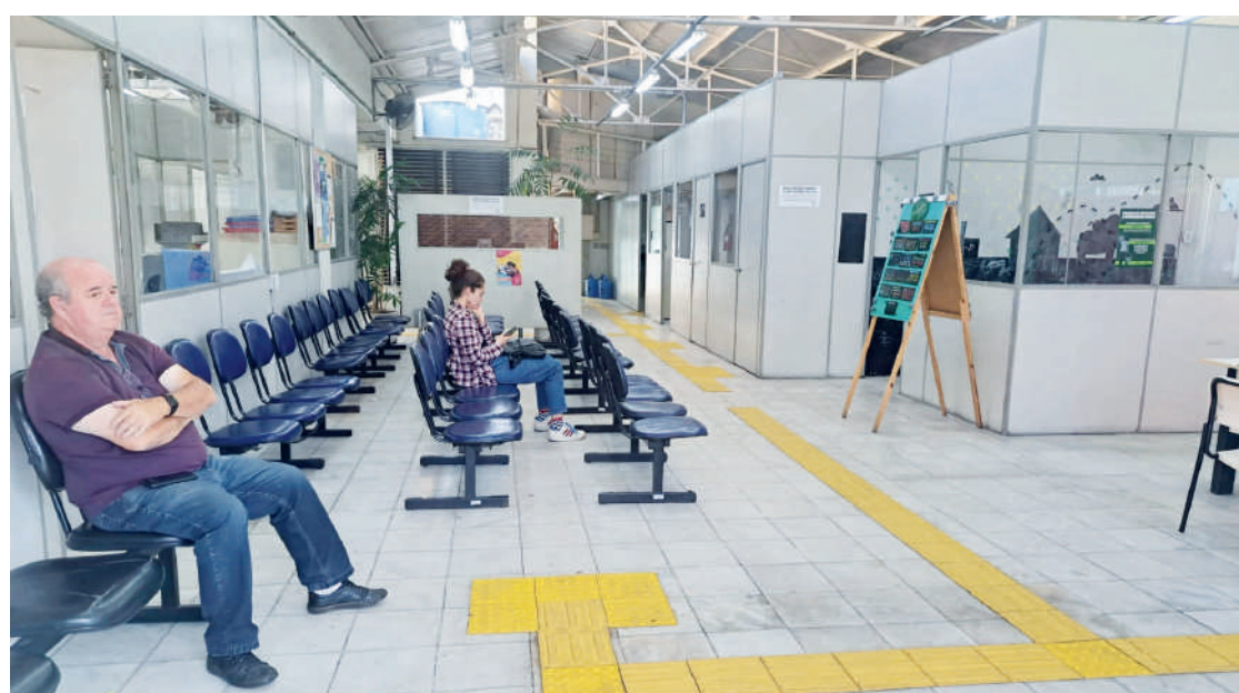
Interessados devem se cadastrar no CREAS, na rua Taquarichim, 296, para entrar na fila