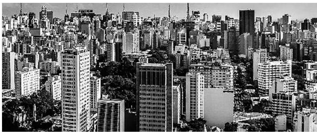
Em 2021, a cidade possuía 547,4 milhões de m² de área construída, segundo o estudo.

Entre os principais resultados, o estudo sinaliza que a cidade possuía, em 2021, 547,4 milhões de m² de área construída. Deste total, 65,8% apresentavam uso residencial, com destaque para o "Uso Residencial Vertical Médio Padrão". Somados, tipos de comércio e serviços detinham 22,5% da área construída. Os