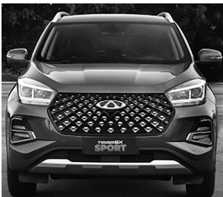
Mais de 40 mil Tiggo 5x foram produzidos no Brasil.

A plataforma T1X do TIGGO 5x também conta com estruturas longitudinais na parte inferior, abaixo do assoalho, que absorvem e distribuem de forma uniforme a energia gerada em caso de colisão. Essa característica proporciona maior resistência e segurança aos ocupantes do veículo. Além disso, o TIGGO