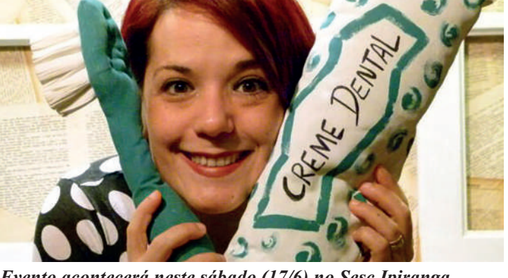
Evento acontecerá neste sábado (17/6) no Sesc Ipiranga.

Cuidar dos dentes brincando. Essa é a proposta do Clube do Dentinho, programa de Educação em Saúde, destinado a crianças de 0 a 12 anos e seus familiares, que propõe estimular hábitos saudáveis e o autocuidado com a saúde bucal e geral. Depois da contação de história, brincando se aprende a importância dos cuidados com a saúde bucal. Monitores recreativos integram a programação do Clube do Dentinho do Sesc Ipiranga. Por fim, no momento da Hora da Escovação, a equipe de saúde bucal da Unidade desenvolve com as crianças conceitos de higiene geral e bucal, através de atividades como o Escovódromo. Serviço: Com Cia Prana de Teatro Duração: 300 minutos LOCAL: ÁREA DE CONVIVÊNCIA Data e horário Sábado Dia 17/6, sábado, das 11h40 às 12h40 e das 13h40 às 14h40 O Sesc Ipiranga fica na rua Bom Pastor, 822