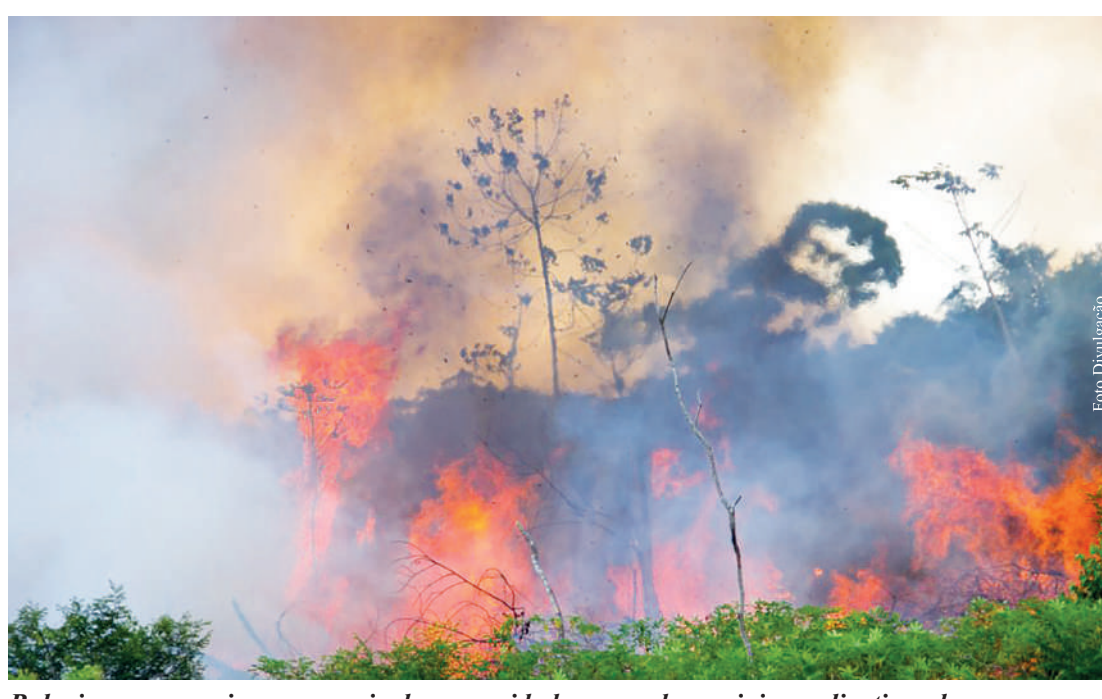
Baloeiros se organizam por meio de comunidades em redes sociais e aplicativos de mensagens.

Com a chegada do período de festas juninas, o perigo de incêndios provocados por balões cresce em todo o estado de São Paulo. A prática - que é crime ambiental - é responsável por graves acidentes, inclusive com vítimas. Os baloeiros estão cada vez mais ousados na hora de confeccionar os artefatos. Em alguns balões de maior porte, há registros de uso de botijões de gás com fogareiros e até mesmo fogos de artifício. Mas, de maneira geral, os mais recorrentes são os balões fabricados com materiais leves e altamente inflamáveis. Grupos de baloeiros costumam se organizar por meio de comunidades em redes sociais e aplicativos de mensagens. Apesar do trabalho da Polícia Militar Ambiental com o objetivo de desarticular esses grupos e apreender balões antes que sejam lançados, muitos ainda conseguem burlar a ação da Polícia e os bolões, em muitos casos são responsáveis por tragédias. Desde primeiro de junho até 30 de setembro, a polícia esta com a Operação SP Sem Fogo, cujo objetivo é coibir a soltura de balões. O combate visa impedir a fabricação, o armazenamento e o transporte dos balões, além de monitorar qualquer atividade suspeita relacionada ao risco provocado por artefatos. E denúncias feitas pela população às autoridades desempenham um papel fundamental nesse trabalho. Além disso, a Polícia Militar Ambiental e o Corpo de Bombeiros promovem ações específicas de educação ambiental para crianças e jovens