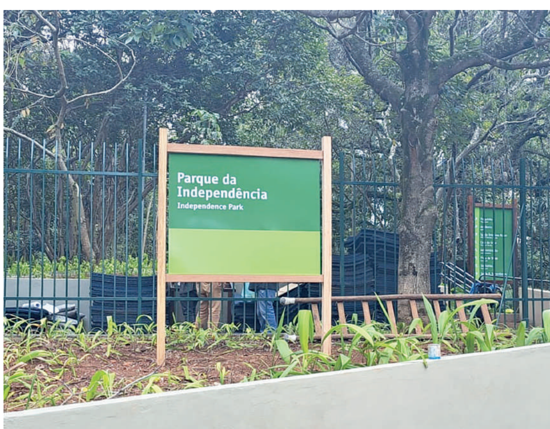
A inauguração, porém, ainda é uma incógnita. Construtora vem adiando obras sucessivamente

Declarada como área de utilidade pública em 2005 pelo então prefeito José Serra e desapropriada em 2008 pelo ex-prefeito Gilberto Kassab, o terreno de mais de 25 mil metros quadrados, que foi anexado ao Parque da Independência, continua, 23 anos depois, sem poder ser utilizado pela população, principalmente jovens e crianças, uma vez que ali está prevista a construção de uma área de lazer com pista de skate e área para recreação.