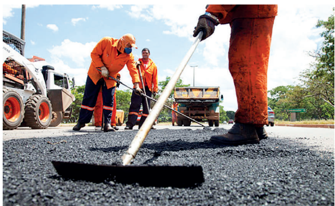
Serviço será realizado em 7 dias e não deverá abranger locais recapados recentemente

Ao final do sétimo dia (12), o objetivo é que as equipes se encontrem e finalizem toda a região. “É um trabalho inusitado. Uma ação inovadora. Aqui no Ipiranga, nós nunca tivemos – pelo menos que eu tenha conhecimento – mais do que três equipes trabalhando. Teremos 25, trabalhando 24 horas por dia, 7 dias consecuti-