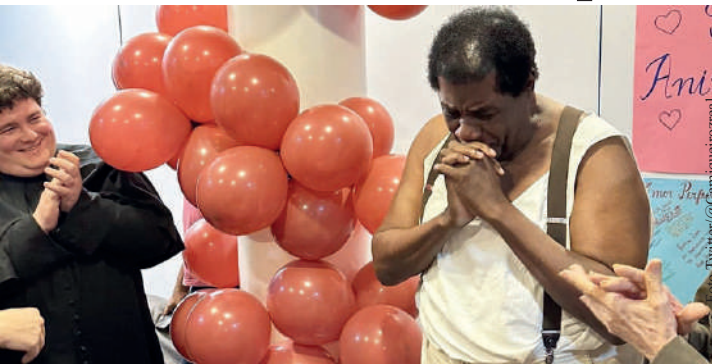
A festa contou com balões vermelhos e mimos dos colegas

Cantor de soul e amigo de Tim Maia na época em que ambos moraram nos Estados Unidos, Tony ganhou o Festival Internacional da Canção em 1970 ao cantar a música “BR 3”