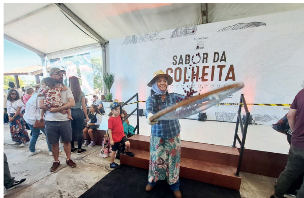
Mulher com roupa típica de cafeicultora encenou como fazer para abanar o café

Cerca de dois mil pés de café são cultivados no Instituto Biológico em sistema orgânico. Fundado em 1928 para estudar a broca do café, praga que assolava as plantações paulistas, o IB sempre teve a cultura em seus objetos de pesquisa. Daí a importância da implementação de seu cafezal, cerca de 28 anos após a fundação do Instituto, e que até hoje serve para a condução de estudos relacionados a pragas e doenças.