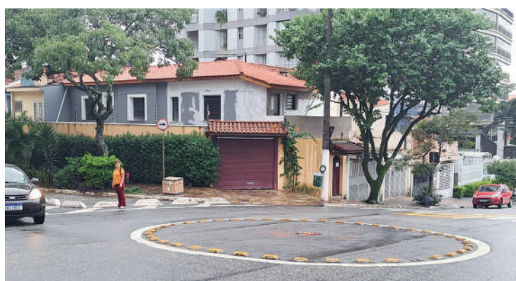
Várias ruas do Ipiranga têm rotatórias padronizadas, mas a Sabesp decidiu diminuir o tamanho levando perigo à população

A equipe de reportagem do Jornal Ipiranga News entrou em contato com a CET para compreender o motivo de a rotatória ter diminuído tanto de tamanho e foi informada de que, a responsabilidade, neste caso em específico, seria da Sabesp, uma vez que a empresa realizou serviços no