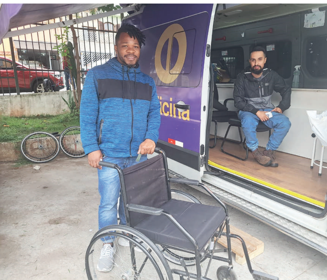
Ação acontece duas vezes por mês, na calçada do Hospital Dia Flávio Gianotti, no Ipiranga

Um serviço considerado de utilidade pública e que beneficia, principalmente, pessoas de baixa renda é o Paraoficina Móvel, iniciativa da prefeitura de São Paulo. Nesta terça-feira (30), esse serviço é inteiramente gratuito, uma van da Paraoficina Móvel, com conta com serviços gratuitos de manutenção e reparo em cadeiras de rodas