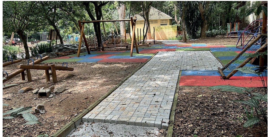
Parquinho atrás do Museu do Ipiranga também está sendo revitalizado pela construtora

A maior prejudicada é, mais uma vez, a população. Tanto do Ipiranga, como dos frequentadores do Parque da Independência. Nesses 23 anos, desde quando o local foi declarado de utilidade pública pelo então prefeito José Serra, foram anunciadas várias medidas com o objetivo de transformar o local em área de lazer e anexar aos 161,3 mil