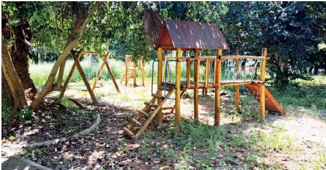
Construtora Frechaltore, que ganhou a licitação, pediu aditivo para entrega das obras

Declarada como área de utilidade pública em 2005 pelo então prefeito José Serra e desapropriada em 2008 pelo ex-prefeito Gilberto Kassab, o terreno de mais de 25 mil metros quadrados, que foi anexado ao Parque da Independência, continua, 23 anos depois, sem poder ser utilizado pela população, principalmente jovens e crianças, uma vez que ali está prevista a construção de uma área de lazer com pista de skate e área para recreação.