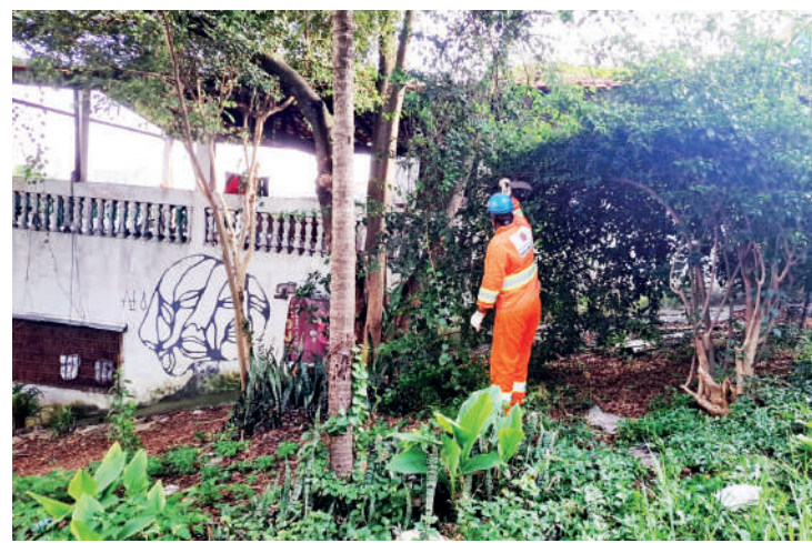
Vizinhos disseram que o local estava há dois anos "abandonado"

Semana passada, o Jornal Ipiranga News esteve no local depois de receber reclamação de moradores da região a respeito da falta de zeladoria da praça sob a alegação de que o local estava abandonado há dois anos, sem nenhuma ação de limpeza. Contrariando a