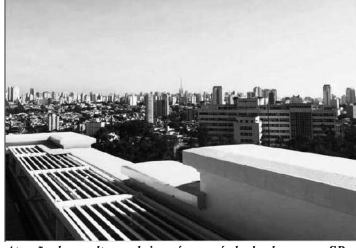
Atração deve voltar a abrir após o período de chuvas em SP

Uma das principais e mais chamativas atrações do Novo Museu, o mirante, está fechado durante o verão, por conta das condições climáticas adversas e as fortes chuvas que têm sido praticamente diárias na cidade, o que prejudica a qualidade da visão 360º que o espaço oferece. De acordo com informações da Assessoria de Imprensa do Museu, ao término da estação, a visitação deverá ser retomada normalmente. Alguns dizem que a previsão é que a reabertura aconteça em abril, mas ainda segundo a assessoria, a informação está imprecisa.