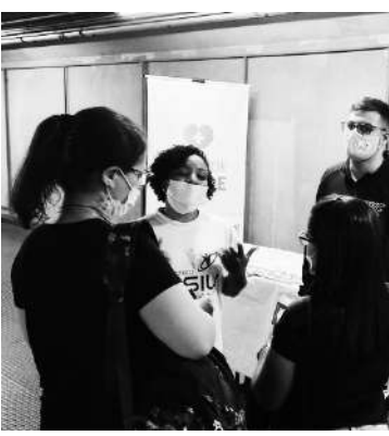
e que ajudam a prevenir doenças. Como forma de apoio à campanha, a fachada da unidade

Na sexta-feira (14), das 9 às 13 horas, o Terminal Jabaquara da EMTU receberá uma ação em parceria com a ProZ Educação, a qual objetiva conscientizar a população sobre o autismo. O evento será uma ação de saúde relacionada ao Abril Azul. A ação contará com profissionais e alunos da ProZ abordando os passageiros e conversando sobre as questões que envolvem a pessoa autista, além de realizar teste de glicemia e aferição da pressão arterial, exames simples