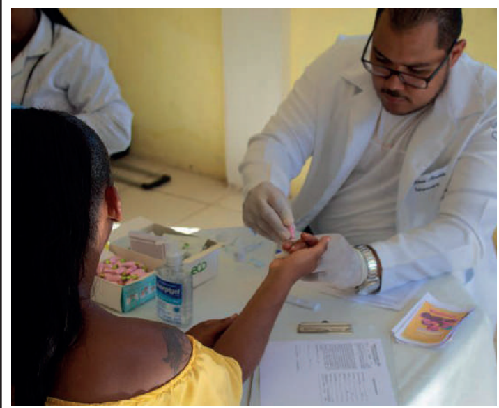
Ação acontecerá junto à outros eventos na comunidade

Neste sábado (15), das 9 às 17h, a iniciativa “Hepatite C Pode Estar ao Seu Redor”, liderada pela Gilead e produzida pela Yabá Consultoria, realizará uma ação de teste em Heliópolis, na qual moradores da comunidade saberão se estão ou não contaminados pela Hepatite C com resultados entregues em 10 minutos.