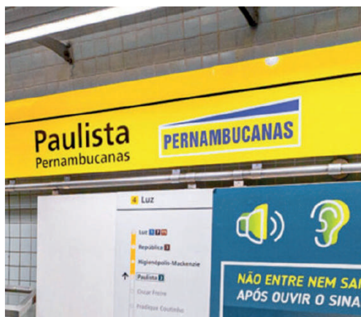
Placa da estação já está com a marca da loja varejista