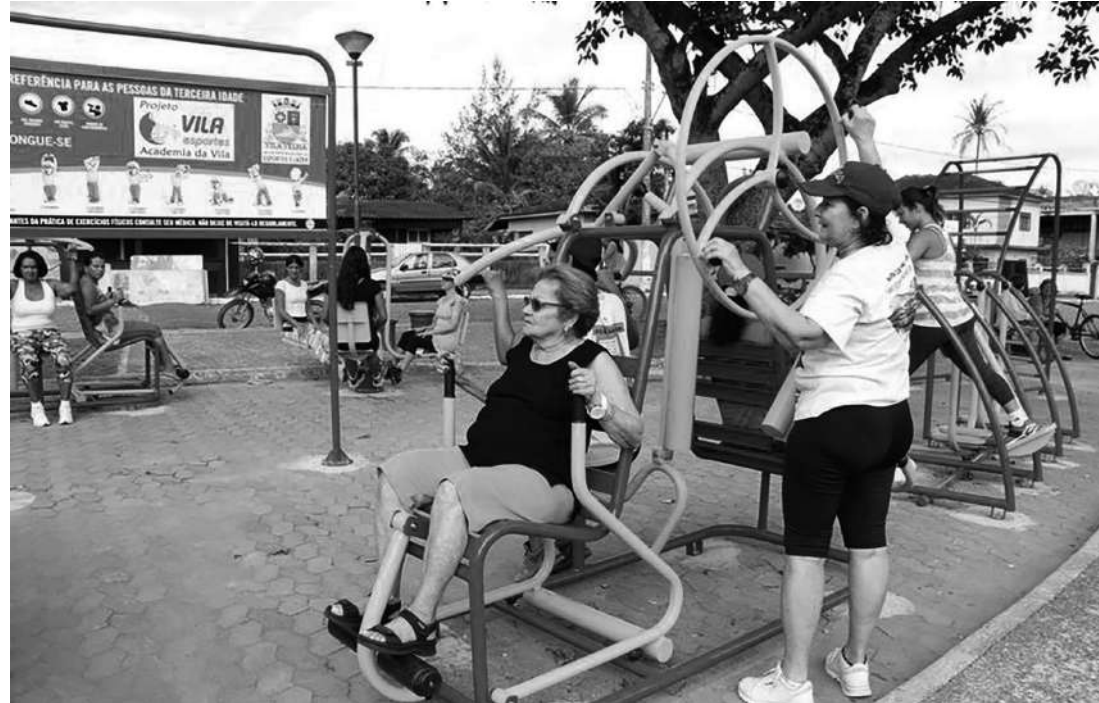
Tudo o que executamos no dia a dia, como subir escadas, é considerado atividade física

de uma caminhada, manejando a cadeira de rodas, além de outras formas, como pedalar, remar, patinar, andar a cavalo, de skate ou de patinete (sem motor). No trabalho ou estudo - Pode ser feita como uma forma de desempenhar suas funções laborais ou de estudo, como participar das aulas de educação física, brincar no recreio ou intervalo entre as aulas e, também, antes ou depois delas, além de carregar objetos, caminhar, correr e limpar, entre outras. Nas tarefas domésticas - Durante o cuidado com o lar também podemos desempenhar algumas atividades físicas como adubar e regar as plantas, cortar a grama, dar banho nas crianças, nos idosos ou no animal de estimação, assim como varrer, esfregar ou lavar.