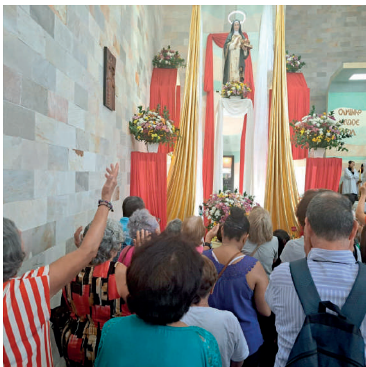
Mesmo sendo segunda-feira (16), os fiéis não deixaram sua fé, devoção e gratidão à Santa Edwiges de lado e estiveram na Igreja

Para o dia de Santa Edwiges, a Paróquia preparou uma programação especial, com missas durante o dia inteiro – algumas com presenças especiais de importantes Padres – além da tradicional quermesse, que acontecerá até o final do mês, com diversas atrações