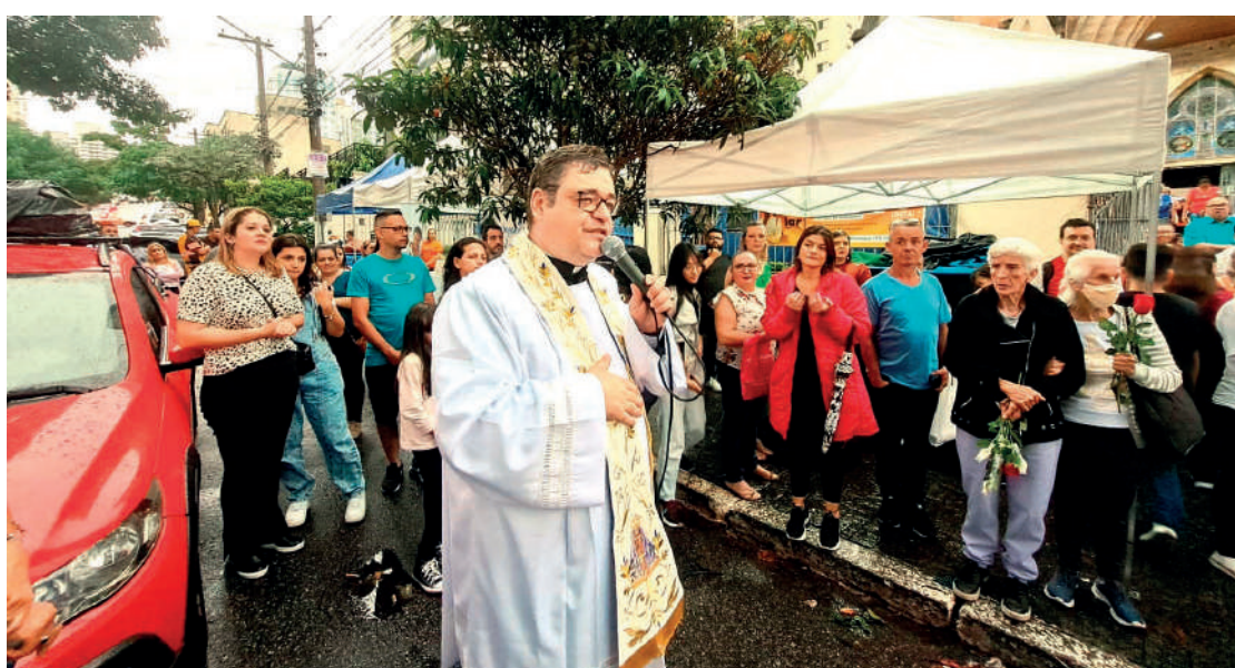
Mesmo sem a tradicional procissão, Igreja ficou lotada de devotos durante o dia inteiro da festa