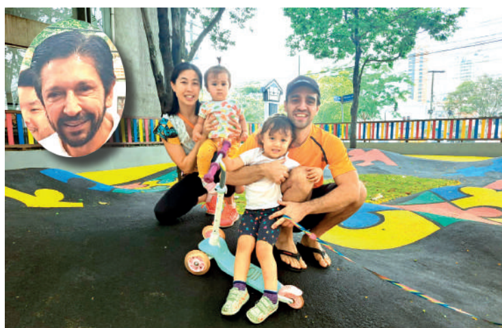
Esta foi a segunda unidade do Parque inaugurada pela Prefeitura

Nesta quinta-feira, dia 12 de outubro, Dia das Crianças, São Paulo inaugurou o segundo play lúdico do Brasil, um espaço inteiramente dedicado à primeira infância, localizado na Saúde. O primeiro foi inaugurado no final de junho, na Praça São Sebastião, no Ipiranga.