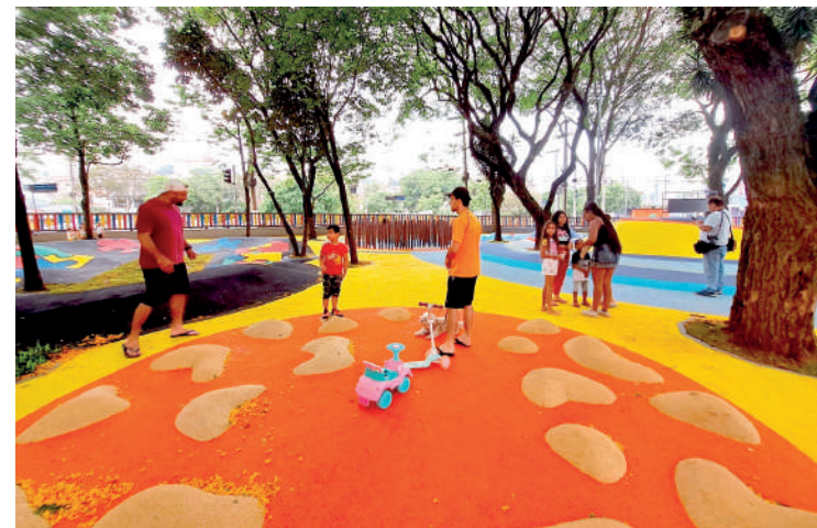
No dia da inauguração, diversas crianças se divertiram no local

As cores vibrantes, os desenhos e a própria geometria desses espaços são estímulos ao aumento da capacidade sensorial e motora, além de desenvolverem a imaginação. Nos play lúdicos cada detalhe foi planejado para