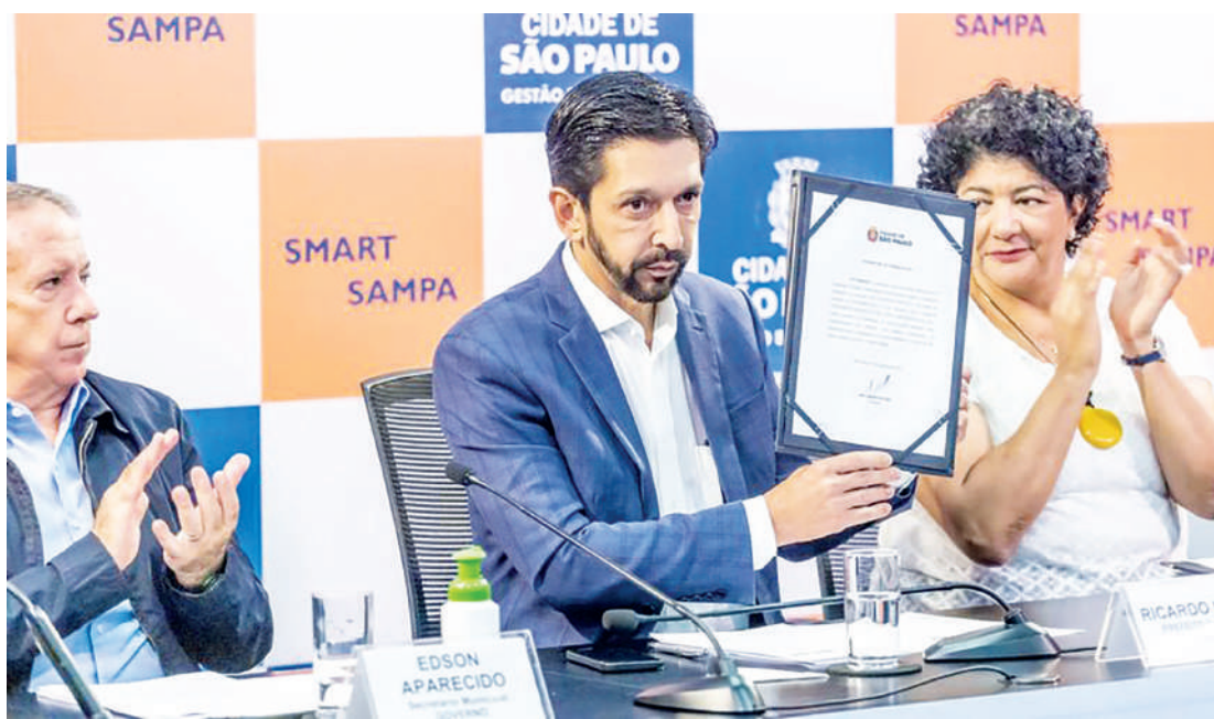
Prefeito anunciou a implantação das câmeras, que custarão R$ 9,8 milhões por mês aos cofres públicos

A região central, que atualmente acumula preocupações com furtos e roubos de celulares e abriga a chamada Cracolândia, receberá 3,3 mil câmeras, o segundo menor número, embora também tenha tido, há cerca de um mês, reforço de 440 agentes da Guarda Civil Metropolitana. É também no centro que serão instaladas as primeiras 200 câmeras do projeto, dentro de dois meses. A perspectiva