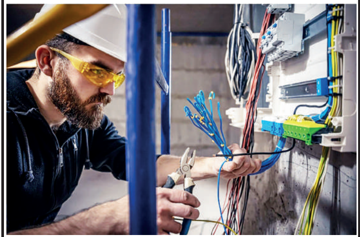
A falta de manutenção pode desencadear choques elétricos