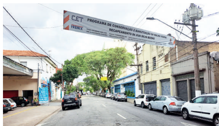
Serviços deveriam ter começado no dia 20 de abril

A Prefeitura deu início ao recalpeamento da rua Silva Bueno, uma das principais vias de acesso ao bairro e também a principal rua comercial do Ipiranga. O recalpeamento da Silva Bueno faz parte do programa da Prefeitura para recalpear as principais vias da cidade, com investimento de aproximadamente 1 bilhão. Acontece que, de acordo com as faixas colocadas ao longo da via, os serviços deveriam começar no dia 20 de abril, mas apenas nesta quarta-feira (9) é que guias, sarjetas e calçadas começaram a ser realizados em um pequeno trecho da via.