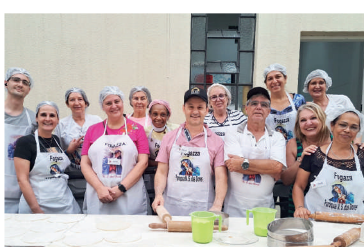
Voluntários (foto) da tradicional barraca da Fogazza