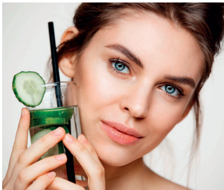
O pepino já foi um dos protagonistas nos cuidados faciais

Consumir pepino regularmente pode ajudar a melhorar a elasticidade da pele, graças ao seu alto teor de silício, um mineral que fortalece o tecido conjuntivo. Além disso, sua ação diurética natural favorece a eliminação de toxinas e o combate à retenção de líquidos, problemas que podem afetar a aparência e a saúde em geral.