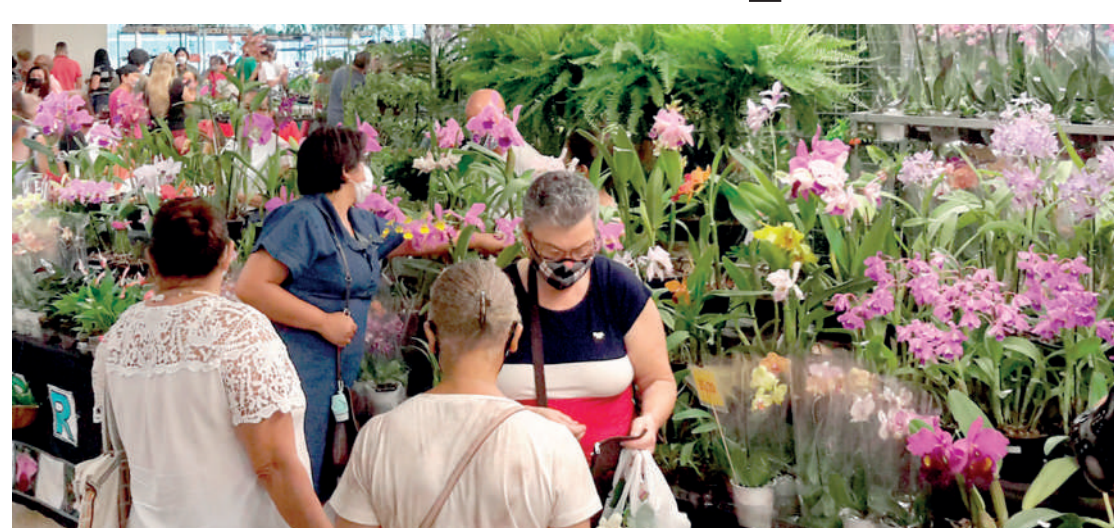
Evento com entrada grátis acontece no final de semana em Mirandópolis. PÁGINA 4