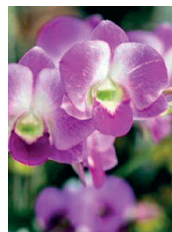
Aproveite a entrada gratuita

O evento será realizado no sábado (20) das 9h às 18h e domingo (21) das 9h às 16h. Rua das Rosa, 86 - Mirandópolis, próximo à estação Praça da Arvore do Metrô.