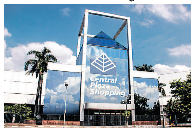
Shopping fica na avenida Doutor Francisco Mesquita, 1000

Para quem adora jogos eletrônicos, o espaço é equipado com atrações de última geração e proporciona os melhores jogos, fliperamas e diversões eletrônicas para toda a família. A variedade de opções oferece entretenimento para crianças e adultos, tornando o Parks &