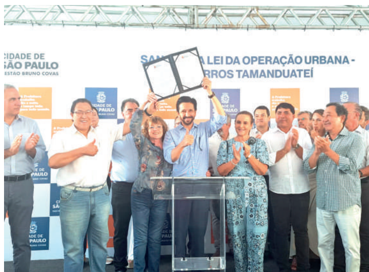
Obras devem durar 20 anos e serão arrecadados R$ 1.15 bi

Em toda a operação, participam os setores privado, público e a sociedade civil. A ação deve contemplar ainda a abertura do Rio Tamanduateí em uma faixa de 1,8 km e 12 novos parques, dos quais, alguns serão “inundáveis”, ou seja, planejados para ajudar no escoamento de águas das cheias, como nas proximidades do Córrego do Moinho Velho