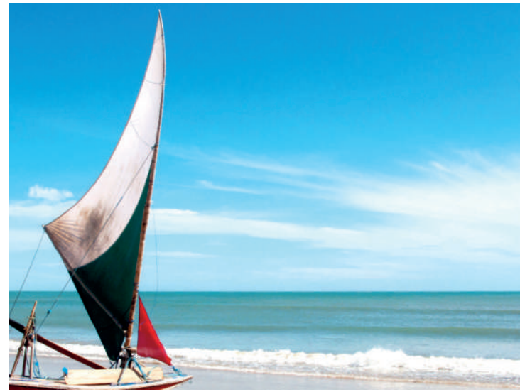
Costa cearense guarda as mais belas praias do Brasil e do mundo

Fortaleza é o retrato de um Nordeste diferente. Na aparência, a capital cearense tem ares cosmopolitas, está mais para Rio de Janeiro do que para Recife. A orla é impressionante, com seus prédios vistosos e os coqueiros bem arranjados, nas calçadas, os praticantes de jogging, os ciclistas, os carros importados e as inúmeras lanchonetes muito bem frequentadas. A infraestrutura também impressiona: uma centena de hotéis, seguidos de dezenas de apart-hotéis e pousadas na cidade. A programação noturna é animadíssima de segunda a segunda e os shopping-centers fazem parte do dia a dia de todos, moradores e turistas. E agora, neste período de férias, a cidade fica ainda mais agitada.