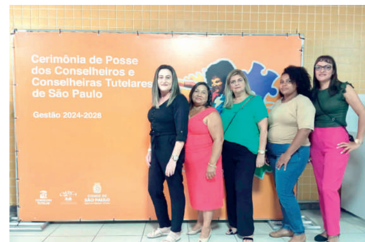
Conselho Tutelar do Ipiranga é composto só por mulheres