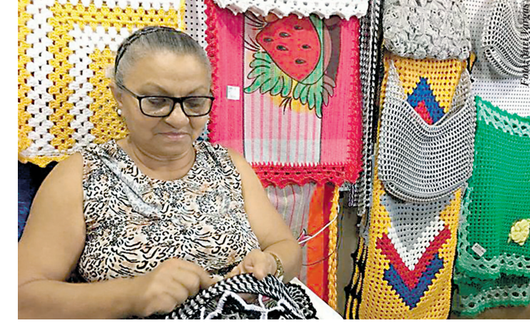
Cursos são gratuitos e online; basta acompanhar a programação

o setor financeiro e a produção artesanal, a comercializar em diversos canais de venda (offline e on-line), a estabelecer parcerias e a colocar preço em produtos artesanais. Toda semana, alguns módulos serão liberados para participação. Cada módulo ficará aberto para acesso e conclusão por uma semana, de segunda-feira a domingo. Depois de encerrados, serão abertos novamente em momento posterior. Nesta semana, os empreendedores poderão assistir às aulas de Modelagem de negócio e Planejamento de coleção. Aulas de revisão ao vivo Com conteúdo gravado, as aulas poderão ser feitas em qualquer dia e horário, por meio de dispositivos fixos e móveis, durante o período que o módulo permanecer aberto na plataforma. Nesta semana, as aulas de revisão serão realizadas no dia 3 de janeiro, quarta-feira. A revisão do módulo “Mo-