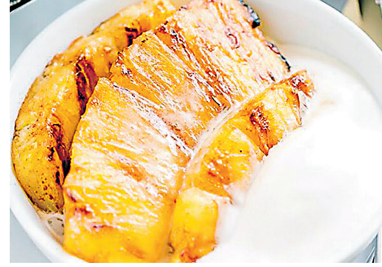
Abacaxi grelhado já virou estrela para encerrar churrasco

Adicione a manteiga e leve ao fogo para cozinhar, sempre mexendo. Mexa até soltar do fundo da panela, como o ponto do brigadeiro tradicional. Deixar esfriar e enrolar as bolinhas no tamanho que desejar. Passe as bolinhas em açúcar cristal e canela. Coloque em forminhas de papel. Variação: Se preferir, passe os brigadeiros em coco ralado, ou canela em pó, ou em queijo tipo Parmesão ralado. Pizza Suflê Ingredientes: 10 fatias de pão de forma, sem casca; 1 xícara (chá) de leite; 2 tomates médios maduros e cortados em rodela finas; 100 gramas de queijo tipo Mussarela fatiado; 3 ovos grandes; 1 lata de atum em óleo; queijo tipo Parmesão ralado; orégano a gosto; sal e pimenta-do-reino a gosto. Preparo: Unte com manteiga ou margarina um refratário quadrado 20 cm. Passe as fatias de pão de forma no leite e vá montando camadas no