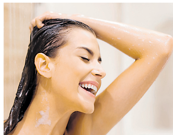
Um gesto simples que faz a diferença no seu ritual de beleza

A aparência dos xampus sólidos lembra a de uma barra de sabonete, mas sua formulação é especificamente desenvol-