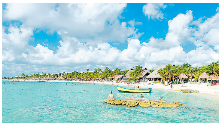
Cada praia tem seu próprio encanto com águas de cor turquesa

imaculadamente brancas que caracterizam Los Cabos, a região é conhecida por seus resorts luxuosos, frequentados por uma clientela exclusiva. A atmosfera de conforto e suntuosidade é acentuada pelo clima ameno, onde o sol parece permanentemente ajustado à temperatura ideal. Nos refinados restaurantes, os cardápios revelam uma fusão de sabores, oferecendo o melhor da cozinha internacional entrelaçado com as autênticas delícias da culinária