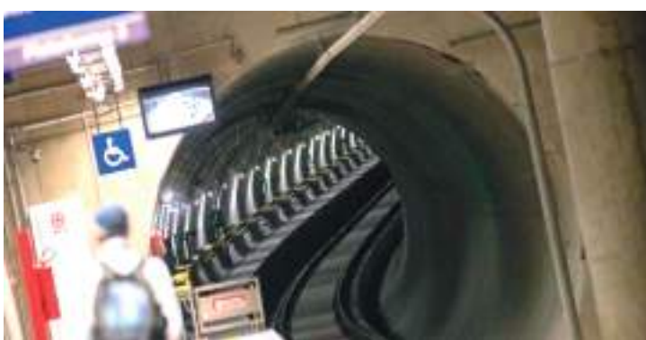
Projeto prevê construção de 7km de trilhos e 6 novas estações

Com a conclusão da escavação, a instalação de trilhos, sistemas elétricos e sinalização será iniciada, tornando