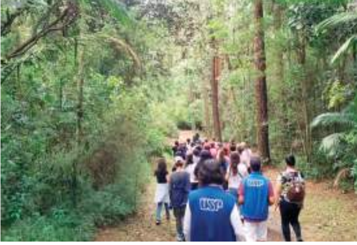
Trilha Ecológica guiada é oportunidade de estar perto da natureza

O parque fica na Av. Miguel Estefano, 4200, com entrada e estacionamento gratuitos. Recomenda-se o uso de roupas leves, calçado fechado, protetor solar e levar água. Há espaço para piqueniques, mas não há venda de alimentos no local.