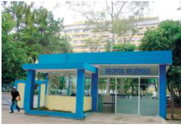
Hospital Heliópolis é referência na região e está abandonado

Na região Sul, serão repassados R$ 98 milhões para recuperação de 10 unidades, entre elas o Instituto Dante Pazzanese de Cardiologia, na Vila Mariana, o Hospital Heliópolis, no Ipiranga, e os Hospital Infantil Darcy Vargas, Hospital e Maternidade Interlagos.