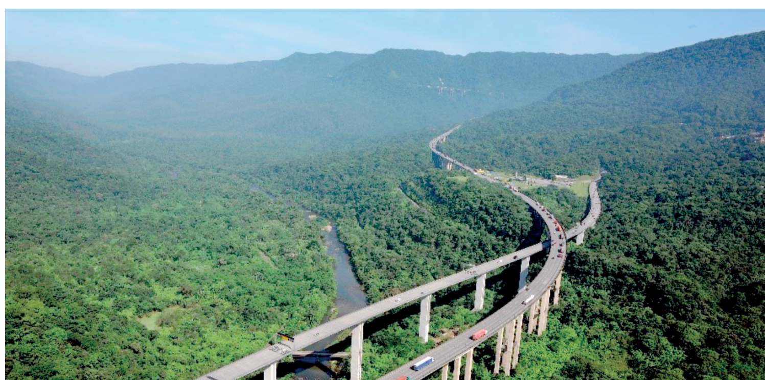
A proposta da 3ª pista da Rodovia dos Imigrantes traz inovação com túneis modernos e maior capacidade de tráfego. A obra promete aumentar em 25% a eficiência do sistema e transformar o acesso ao Porto de Santos e ao litoral paulista. PÁGINA 4