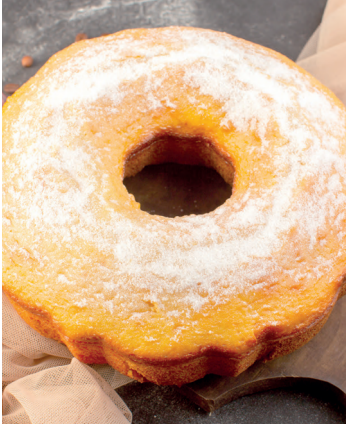
Uma fatia é sempre bom

Ingredientes: 2 xícaras (chá) de açúcar; 4 colheres (sopa) de margarina sem sal; 3 ovos; 1 xícara (chá) de leite; 3 xícaras (chá) de farinha de trigo; 1 colher (sopa) de fermento em pó; 2 colheres (sopa) de chocolate em pó. Preparo: Não use batedeira, bata com colher de pau. Misture o açúcar com a margarina até ficar bem homogêneo, adicione os ovos inteiros, um a um, batendo sempre a cada adição. Alternadamente, vá juntando a esta mistura, o leite e a farinha, aos poucos, batendo sempre. Por último, acrescente o fermento em pó. Separe um pouco da massa em uma tigela e acrescente o chocolate em pó. Unte uma forma (redonda de buraco no meio) com margarina e polvilhe com farinha de trigo, despeje metade da massa branca, por cima coloque a massa com chocolate e finalize com massa branca.