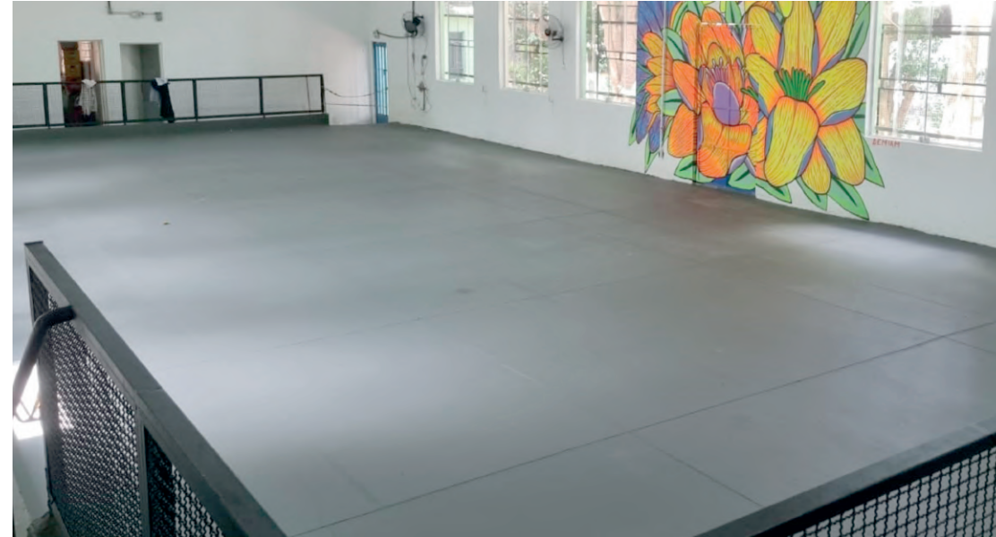
Inauguração será neste sábado (18) com diversas aulas para a comunidade

A partir do dia 18 de janeiro, o CDC (Clube da Comunidade) Castúlio do Amaral, localizado na Rua Pierre Curie, 286, no Jardim da Saúde, inaugura um novo salão de dança, oferecendo aulas variadas para a comunidade. O espaço de 200m² contará com modalidades como jazz, k-pop, fitdance, street jazz e clássicos dos anos 70, 80 e 90. Em parceria com o Studio B Dance Academy, o clube também disponibiliza vestiários, armários para guarda-volumes e um lounge de convivência. O evento de inauguração, das 9h às 12h, contará com aulas e apresentações especiais, incluindo dança do ventre e k-pop. Com o objetivo de promover bem-estar e felici-