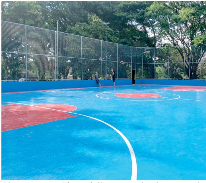
Obra era para ter sido concluída em novembro do ano passado

O atraso na entrega total do espaço levanta questionamentos sobre a real funcionalidade da revitalização. Mesmo com um investimento significativo de R$ 1.432.028,50, a falta