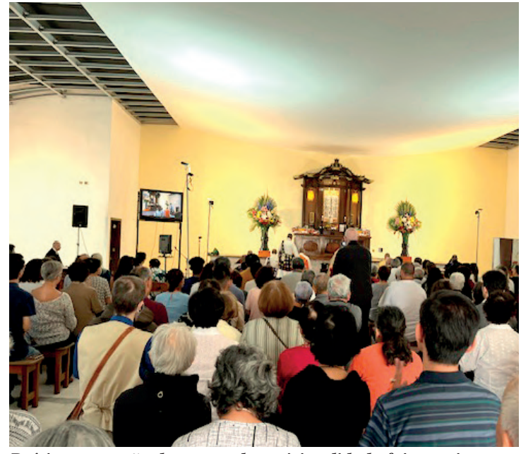
Pré-inauguração do centro de espiritualidade foi emocionante

No Budismo, não há nenhum deus, nenhuma liturgia, nenhum livro sagrado. Por isso, o Budismo original é um estilo de vida não-sectário, que pode ser seguido por