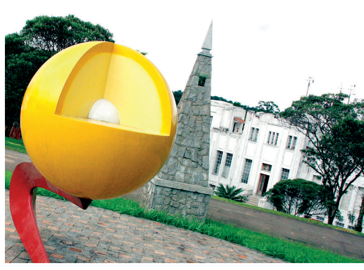
Programação especial no Parque CienTec vai até 31 de janeiro

O Parque CienTec fica na av. Miguel Estefano, 4.200, Água Funda, em São Paulo, em frente ao Zoológico de São Paulo, e funciona de segunda a sábado, das 9h às 16h. A entrada e o estacionamento são gratuitos. Novo telefone: 2648-4300.