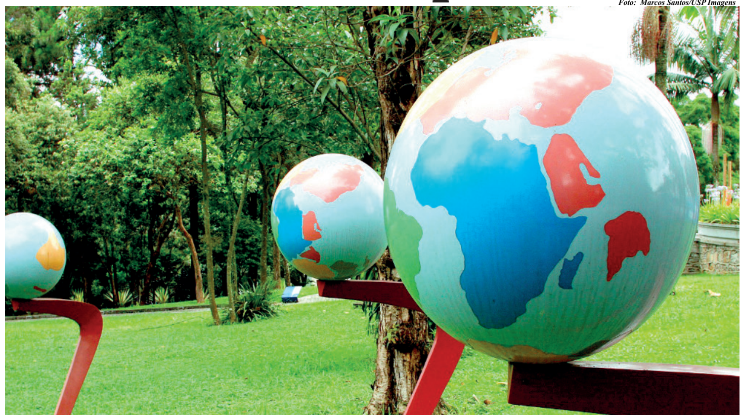
O Parque CienTec da USP oferece atividades gratuitas para todas as idades até 31 de janeiro com trilhas ecológicas e abelhas nativas, as crianças aprendem física brincando e viajando pelo céu no planetário. PÁGINA 3