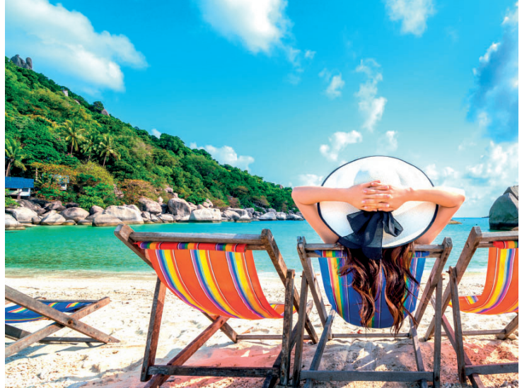
Leve sempre uma sacola para recolher seu lixo na praia

Segundo estudos, mais de 50% das espécies de mamíferos marinhos e aves marinhas já foram impactadas pela ingestão ou