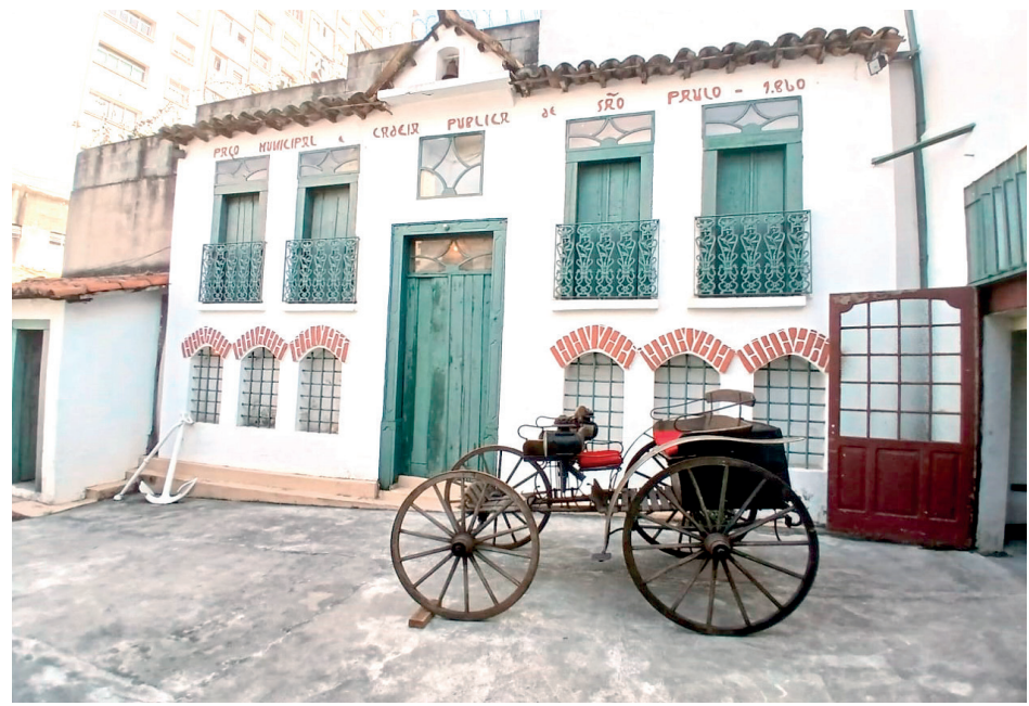
Casas históricas, como a da Marquesa de Santos, podem ser visitadas e admiradas

do seu mundo, que havia sido construído para degustação própria.