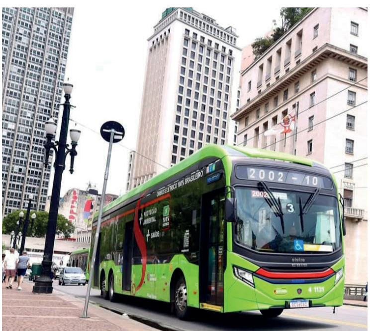
Cidade tem a maior frota de ônibus elétricos do Brasil

Esse novo passo da cidade de São Paulo também levará o Brasil aos primeiros postos do ranking mundial da eletrificação de sua frota de ônibus, atrás apenas da China, e à maior frota de ônibus movidos a energia limpa da América Latina.