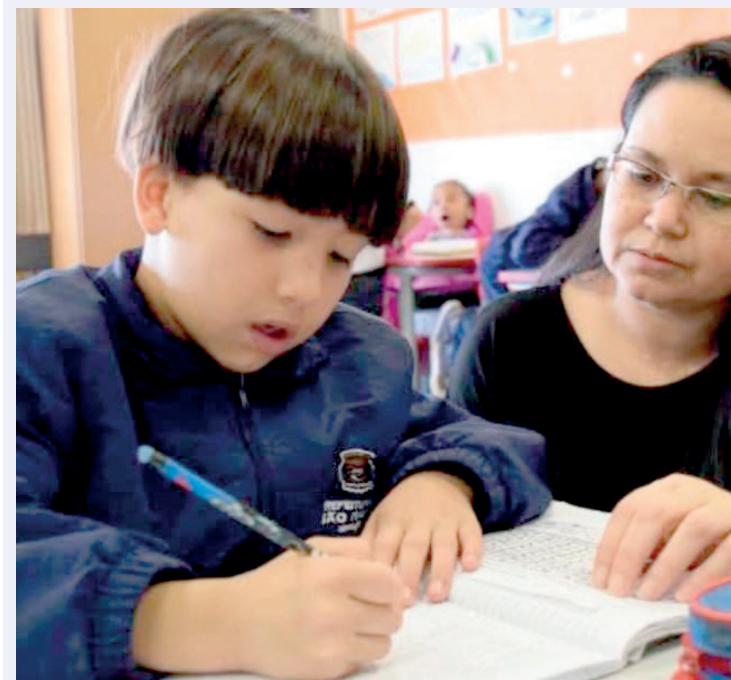
Serão beneficiados 7.441 professores para o ensino infantil

A Prefeitura de São Paulo anunciou que irá prorrogar por 12 meses os contratos temporários de 7.441 professores para atuação nas unidades de educação do ensino infantil ao médio. A medida foi publicada no Diário Oficial do município e vai assegurar que em 2025 a falta de professores será superada com a medida.