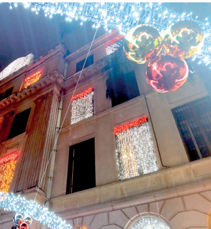
Iluminação estará à disposição até o dia 5 de janeiro de 2025

Na noite desta terça-feira (2), com a presença de diversas pessoas, entre visitantes, pais e alunos, o Colégio Marista Arquidiocesano inaugurou oficialmente sua premiada e tradicional iluminação de Natal, com visita gratuita ao presépio que representa a Sagrada Família.