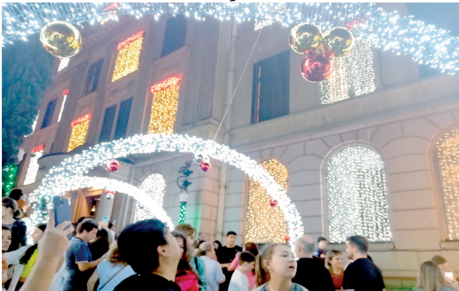
Na noite desta terça-feira (2), com a presença de diversas pessoas, entre visitantes, pais e alunos, o Colégio Marista Arquidiocesano inaugurou oficialmente sua premiada e tradicional iluminação de Natal. PÁGINA 3