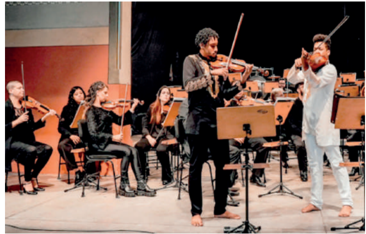
Apresentações acontecem no sábado (7) e domingo (8)

Nos dias 7 e 8, sábado às 20h e domingo, às 18h, Ubuntu Ensemble leva suas performances musicais ao palco do Sesc Ipiranga. O coletivo, formado por músicos cameristas negros(as) originados de diversas regiões do país, tem o objetivo de promover a representatividade negra no cenário da música clássica e destaca a excelência de músicos pretos na música erudita.