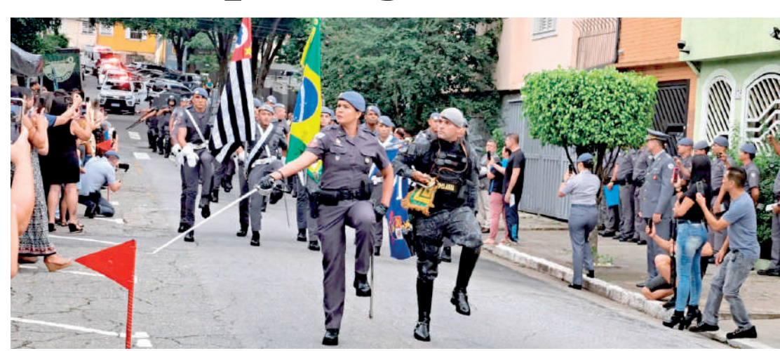
Comemorações do ano passado foram abertas ao público e contaram com desfile dos policiais conversando com a população sobre a atuação do batalhão para região do Ipiranga e suas áreas de abrangência, fazendo questão de agradecer a todos os presentes. O tradicional desfile das viaturas também encantou a todos na data. O motivo pelo qual a celebração não foi aberta ao público e nem a imprensa não foi oficialmente informado.