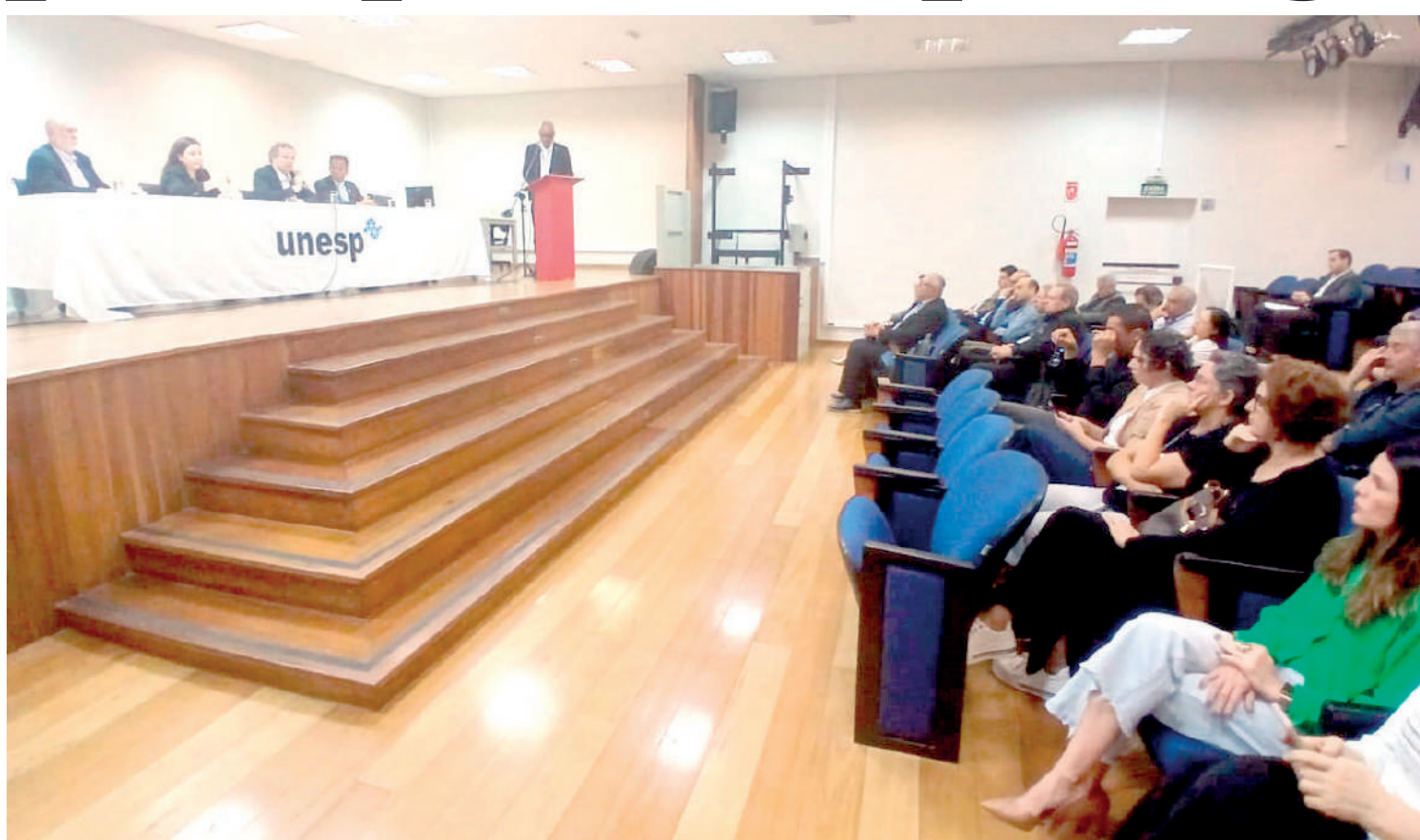
Palestras sobre Gestão de Carbono e Inventário de Emissões de Gases, entre outros assuntos foram ministradas durante o dia

Como é que a gente traz confiança para essas medições, não só da qualidade da energia, mas também da energia verde, limpa, eólica, solar? Como é que a gente faz essas