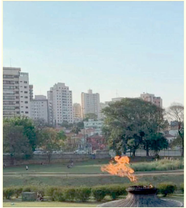
Só é possível se as pessoas usarem as áreas verdes na vizinhança

Pessoas que residem em locais com a maior quantidade de áreas verdes têm menor risco de apresentar obesidade geral, obesidade abdominal e níveis baixos de HDL-colesterol (o colesterol bom). Além disso, têm maior chance de manter a prática de atividade física em intensidade moderada ou vigorosa. Esse é o caso de moradores do Ipiranga, que tem uma imensa área verde no Museu do Ipiranga e também na área que foi anexada recentemente com uma área verde de 25 mil metros quadrados;