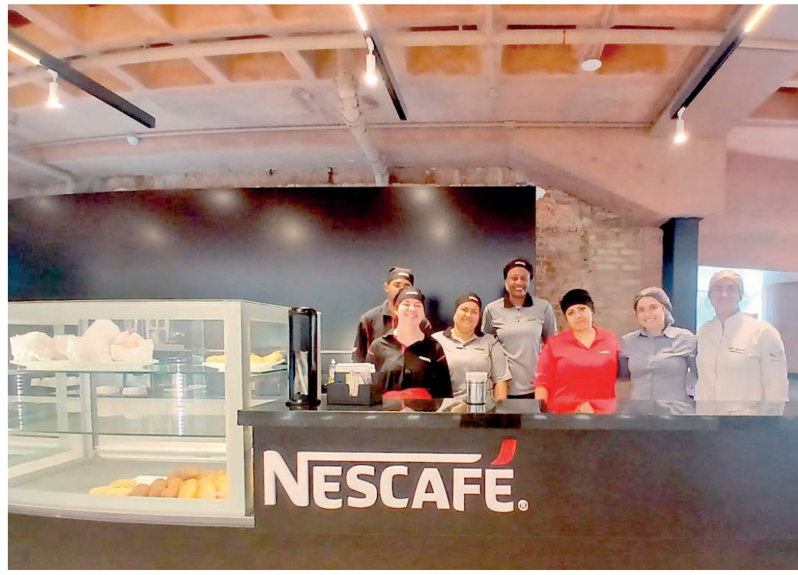
Unidade pertence à Dolcissimo, renomada cafeteria presente em outras localidades de SP e do Brasil

“A expectativa é muito grande. A gente começou com um quadro operacional um pouco reduzido, mas a gente viu que a necessidade é tão grande, que a gente está aumentando mais o quadro operacional para poder atender o público de uma forma que fica acessível para atender o deficiente, o público idoso, os jovens, então, a nossa expectativa é muito grande para a gente poder, cada vez mais, agregar e somar aqui para o Museu também”, informou.