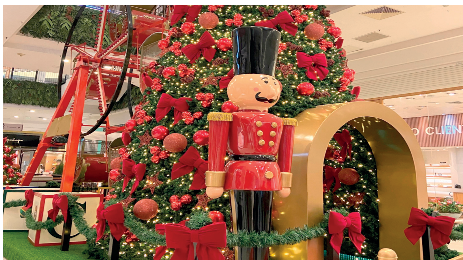
O Shopping Santa Cruz já recebeu o Papai Noel para dar início a um dos momentos mais aguardados do ano, não apenas pelas crianças, mas por toda a família. O Correios também iniciou a sua tradicional campanha das cartinhas. PÁGINA 4