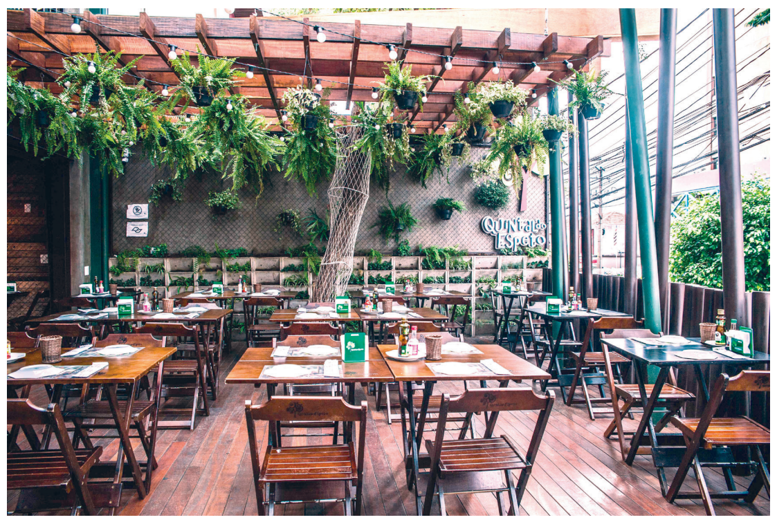
Casa conta com uma rede própria de 10 unidades com máximo conforto e programação musical

Referência em São Paulo, o “Quintal do Espeto” possui nove unidades na cidade (Alto da Lapa, Chácara Santo Antonio, Moema Carinás, Moema Pavão, Perdizes, Santana,