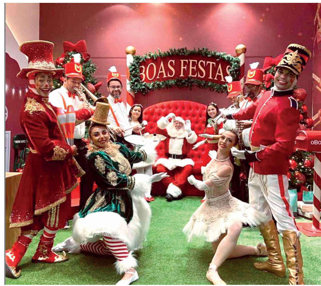
Visitantes poderão fazer fotos e pedidos, inclusive, na presença dos melhores amigos peludos