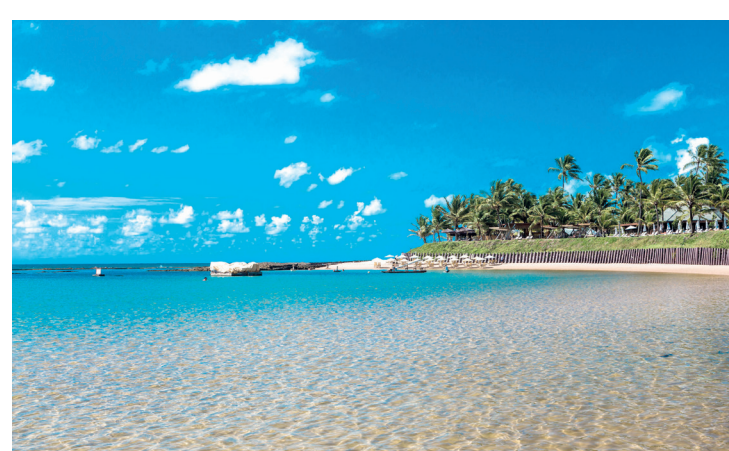
Cidade é uma das mais procuradas por brasileiros e estrangeiros

O principal atrativo de Porto de Galinhas são suas piscinas naturais, formadas por arrecifes de coral que criam verdadeiros aquários a céu aberto. Durante a maré baixa, é possível explorar essas formações de jangada e nadar em meio a cardumes de peixes coloridos, uma experiência que