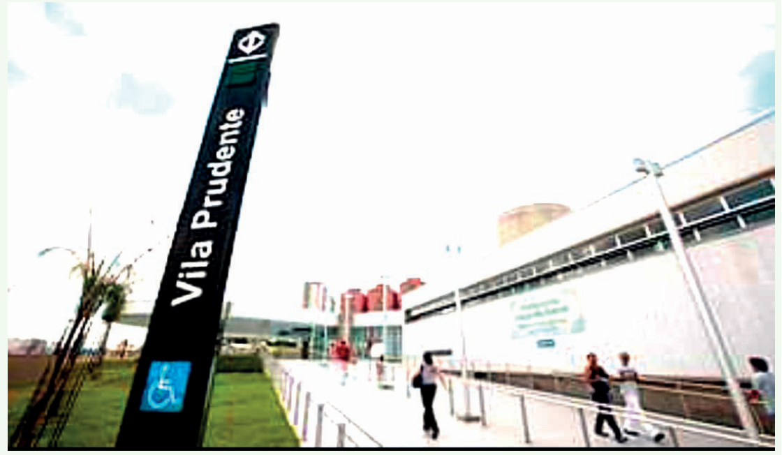
Com a medida, as bilheterias da Linha 2 deixam de atender o público entre 4h30 e 6h e das 22h à 0h

Linha 2-Verde: Santos-Imigrantes, Tamanduateí e Vila Prudente (incluindo a estação da Linha 15-Prata)