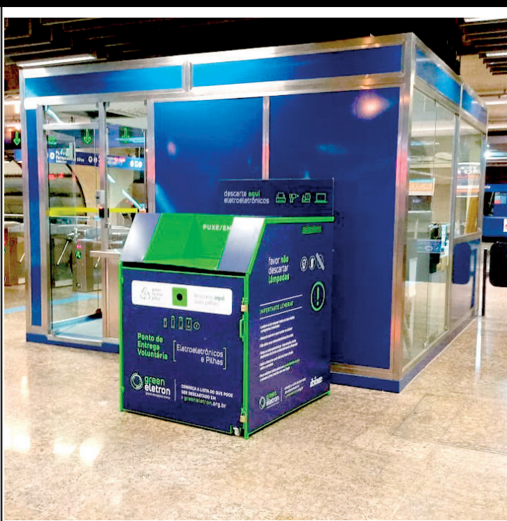
Jabaquara, Saúde e Sacomã são estações que recebem coleta

As estações Jabaquara, Saúde e Sacomã do Metrô estão com pontos de Entrega Voluntária (PEV), para que as pessoas que tenham lixo eletrônico possam descartar os próprios itens eletrônicos, pilhas e baterias sem uso, garantindo a reciclagem. Poderão ser descartados produtos de pequeno e médio porte, como computadores, celulares, cabos, carregadores, pilhas e baterias, secadores de cabelo, consoles de videogame, entre outros.