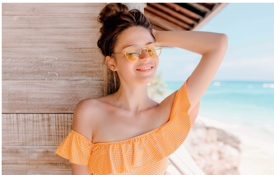
Com a chegada da estação do ano, a busca por uma pele e cabelos saudáveis se intensifica

Usar vários cremes de tratamento simultaneamente pode prejudicar a saúde da pele. O excesso de produtos dificulta a absorção e pode causar o fechamento dos poros, além de reações adversas devido a