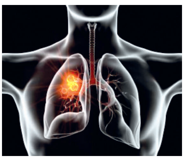
Pessoas com mais de 65 anos de idade são as mais acometidas

O “vilão” do câncer de pulmão segue sendo o tabagismo, motivo pelo qual o alerta maior se dá em torno de combater o cigarro. A compreensão dessas abordagens, segundo a SBCO, é essencial para aumentar as chances de sucesso no tratamento e combater a doença de