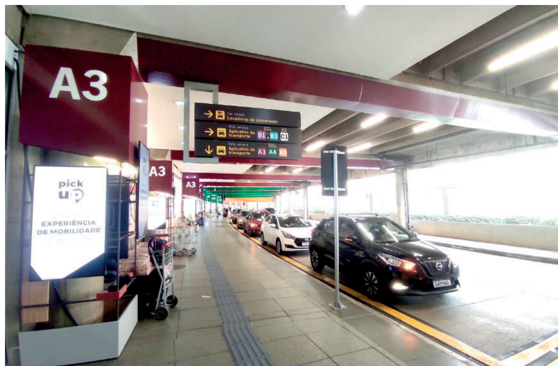
Mudanças têm o objetivo de dar mais agilidade e melhorar o fluxo viário no Aeroporto

Nos primeiros 20 dias de operação, foram identificados alguns casos de uso indevido do local. Para melhorar a eficiência do sistema e a experiência do passageiro, estão sendo avaliadas, em conjunto com as empresas envolvidas, medidas para coibir tais abusos. Entre as possibilidades, está a cobrança de uma taxa aos motoristas que utilizarem o bolsão por tempo excessivo. Para entrar no bolsão, é necessário comprovar que o motorista está na fila virtual do aplicativo