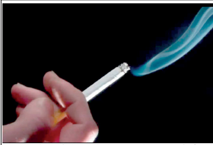
Imposto refere-se à vintena de cigarros, cujo preço será R$ 6,50

Decreto assinado pelo presidente Luiz Inácio Lula da Silva e publicado nesta quinta-feira (1º) no Diário Oficial da União determina o aumento da alíquota do Imposto Sobre Produtos Industrializados (IPI) incidente sobre cigarros e do preço mínimo de venda do produto no varejo.