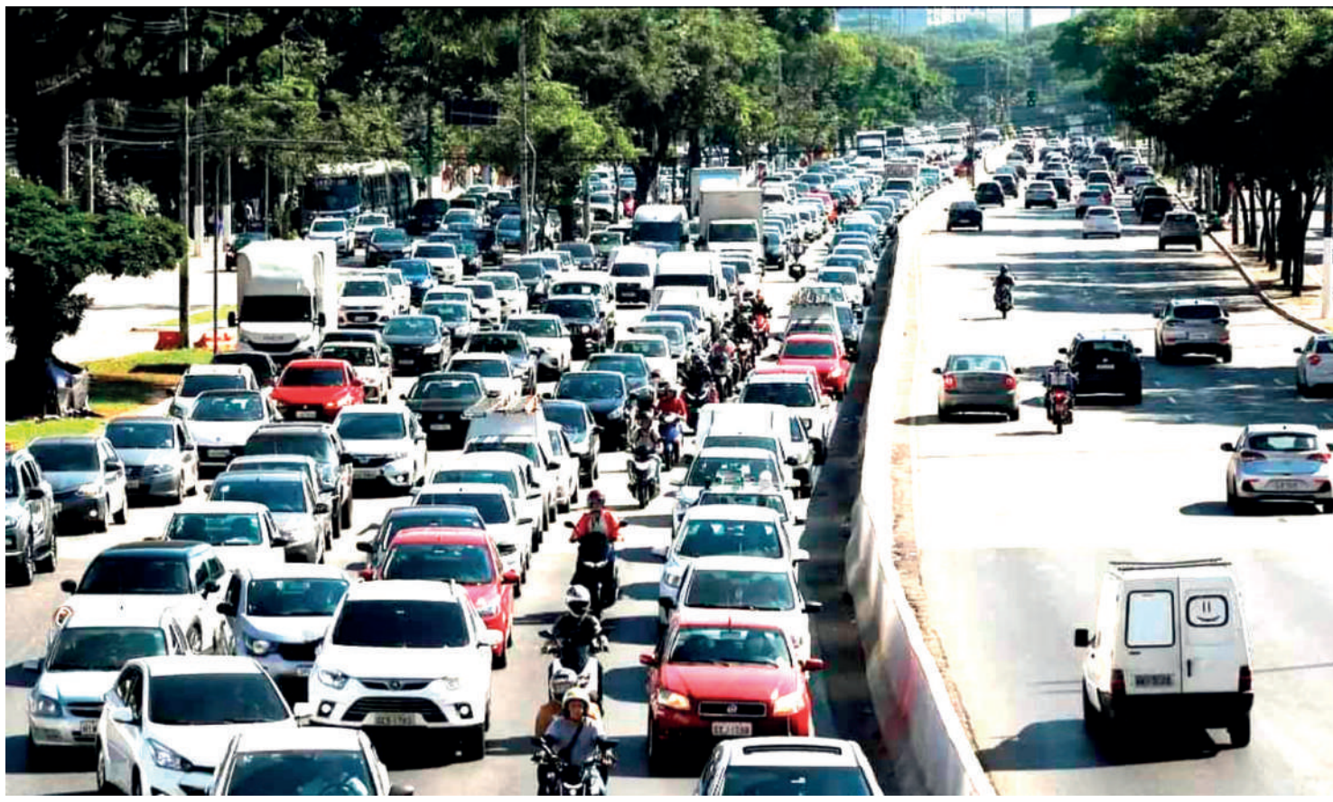
No primeiro semestre de 2024, 2.999 pessoas morreram em acidentes de trânsito apenas no estado. Mil óbitos a mais do que 2023

Vítimas Os motociclistas foram as principais vítimas fatais nas