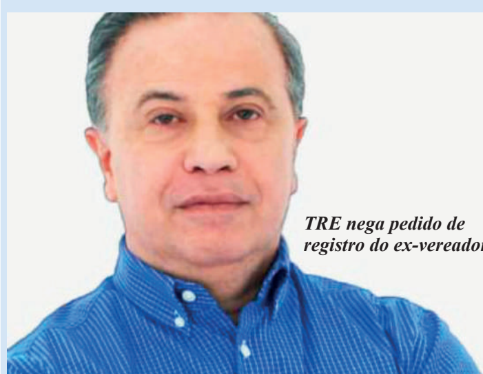
TRE nega pedido de registro do ex-vereador