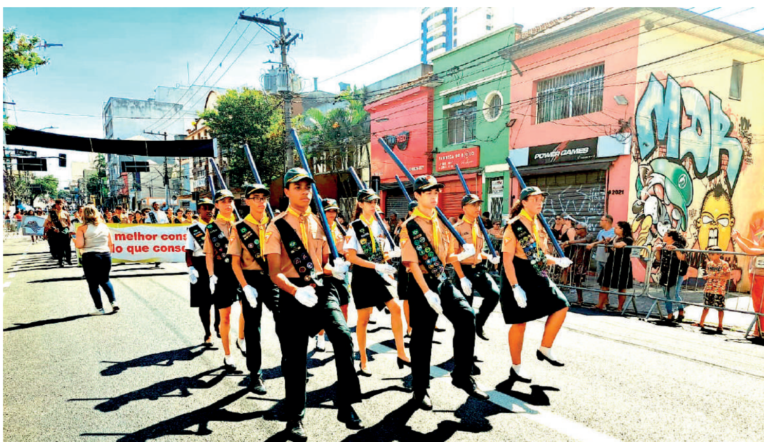
Durante todo o mês de setembro, atividades serão realizadas em variados locais do bairro para celebrar o seu aniversário

Já domingo (15), haverá uma Missa e almoço na Paróquia