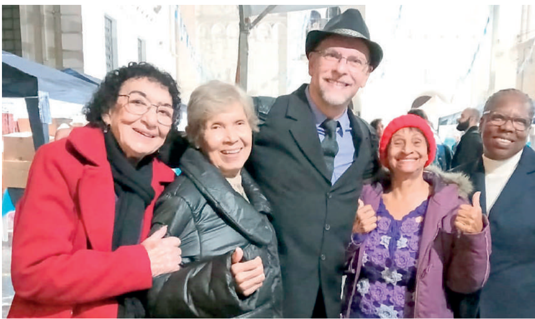
Terça-feira (9), o Dia de Santa Paulina foi celebrado com apresentação do Coral Articurando, barraquinhas de comes e bebes, além de missas o dia inteiro

Durante todo o dia, Missas foram realizadas com diferentes padres; além da presença das tradicionais barraquinhas de comes e bebes e uma apresen-