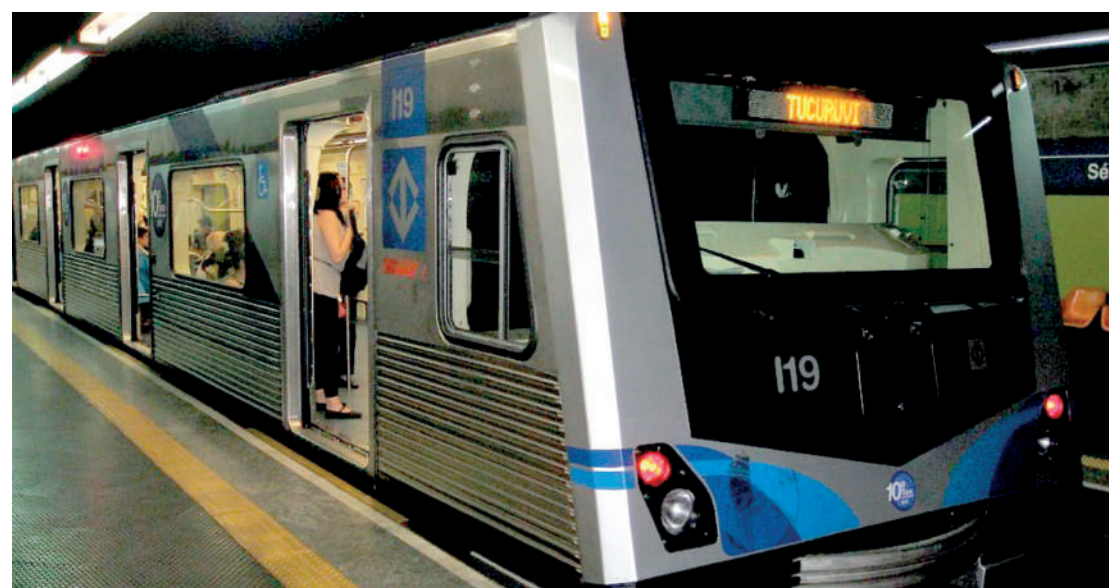
Para incentivar o uso do metrô e dos trens mais cedo à Secretaria dos Transportes Metropolitanos (STM) – CPTM e Metrô – resolveu dar desconto de R$ 0,60 por viagem. PÁGINA 3