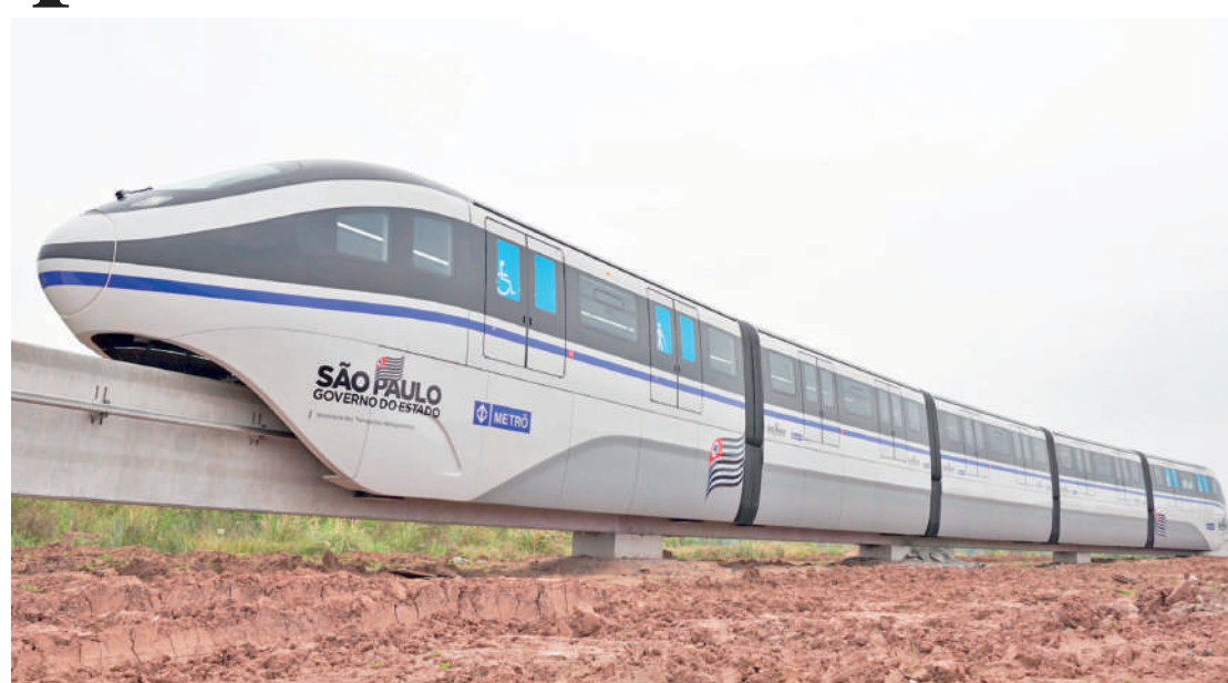
O primeiro trem da Linha 17-Ouro chegou ao Brasil na tarde de sábado (29), vindo da China, onde foi fabricado. PÁGINA 4