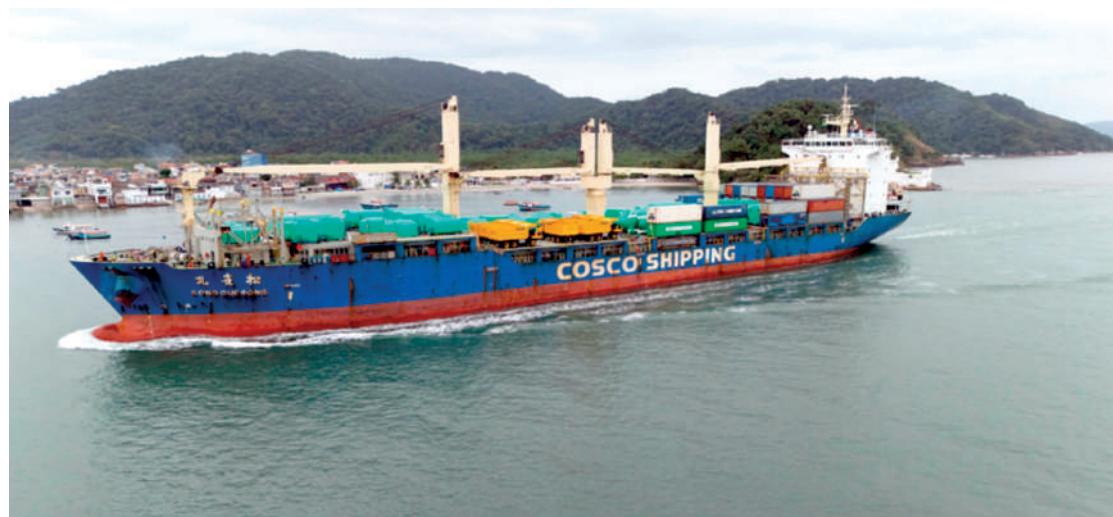
O transporte marítimo do trem foi iniciado em 15 de maio com embarque na região de Xangai

O veículo mede 3,2 metros de largura, sendo que os carros de extremidade possuem 13,5 metros cada e os intermediários medem 10 metros de comprimento, além da área de passagem de 0,95 metros, totalizando 60,8 metros de comprimento. Cada carro possui quatro portas – duas em cada