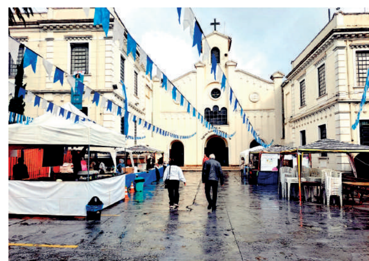
Festejos acontecerão durante o dia inteiro na terça-feira (9)

A festa é preparada pelas Irmãs da Imaculada Conceição, congregação religiosa fundada por Santa Paulina em 1890. No local histórico, onde a religiosa chegou há 133 anos, celebrações estão sendo organizadas para celebrar a sua memória litúrgica, que este ano tem como tema: «Com Santa Paulina, peregrinos (as) da esperança».