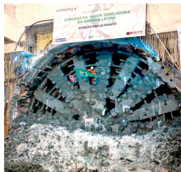
Tuneladora tem a capacidade de escavar até 15 m por dia

Prudente e a Penha, para construir mais 8,4 km (sendo 8 km operacionais) de vias e oito novas estações, cruzando a zona leste de São Paulo. A meta é concluir a primeira etapa, de Vila Prudente a Vila Formosa, até 2026, enquanto o segundo trecho, de Vila Formosa a Penha, está previsto para 2027. Quando pronto, o novo trecho vai agilizar o trajeto dos moradores da região leste e facilitar a chegada às demais regiões de São Paulo, além de redistribuir a demanda de passageiros nas demais linhas de metrô e trem, trazendo mais conforto às pessoas. Moradores do Ipiranga e Vila Carioca serão, também, beneficiados quando a linha-2 entrar por completo em operação.