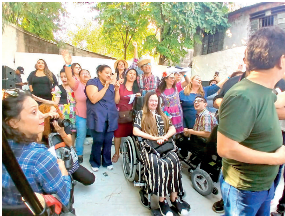
Objetivo principal do projeto é capacitar e fortalecer mães de pessoas com deficiência (PCDs)

“A gente perde um pouco da dignidade, porque a gente não pode trabalhar, nós não podemos estudar, as portas se fecham, nossos filhos não são convidados mais para os aniversários da família, porque podem derrubar uma mesa, babar em cima de um brigadeiro. Então, infelizmente,