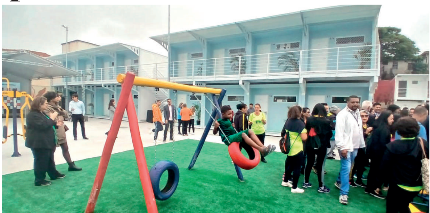
Chamada de "Jabaquara II", a nova unidade da Vila Reencontro na região foi inaugurada na manhã desta terça-feira (25), pelo prefeito da cidade de São Paulo, Ricardo Nunes, junto com outras autoridades e lideranças comunitárias do bairro. PÁGINA 6