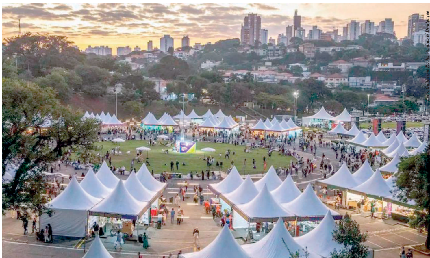
Com novo formato e nova programação, a Feira do Livro volta a ocupar a Praça Charles Miller, em frente ao Mercado Livre Arena Pacaembu (Estádio do Pacaembu), a partir deste sábado (29). PÁGINA 4