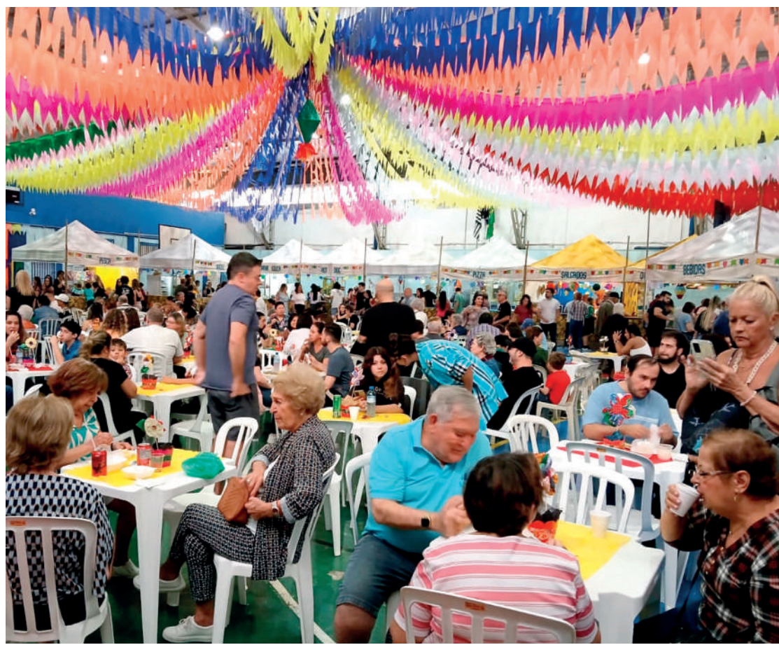
Conhecido como um dos mais tradicionais da região, o Arraiá recebeu milhares de pessoas