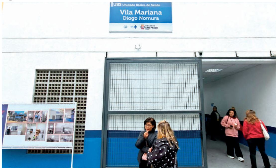
Antes funcionando em um imóvel pequeno e alugado, agora, a UBS da Vila Mariana foi construída em um terreno de 1.305 m2 que pertence ao município e tem capacidade de realizar 4.544 atendimentos por mês. PÁGINA 2