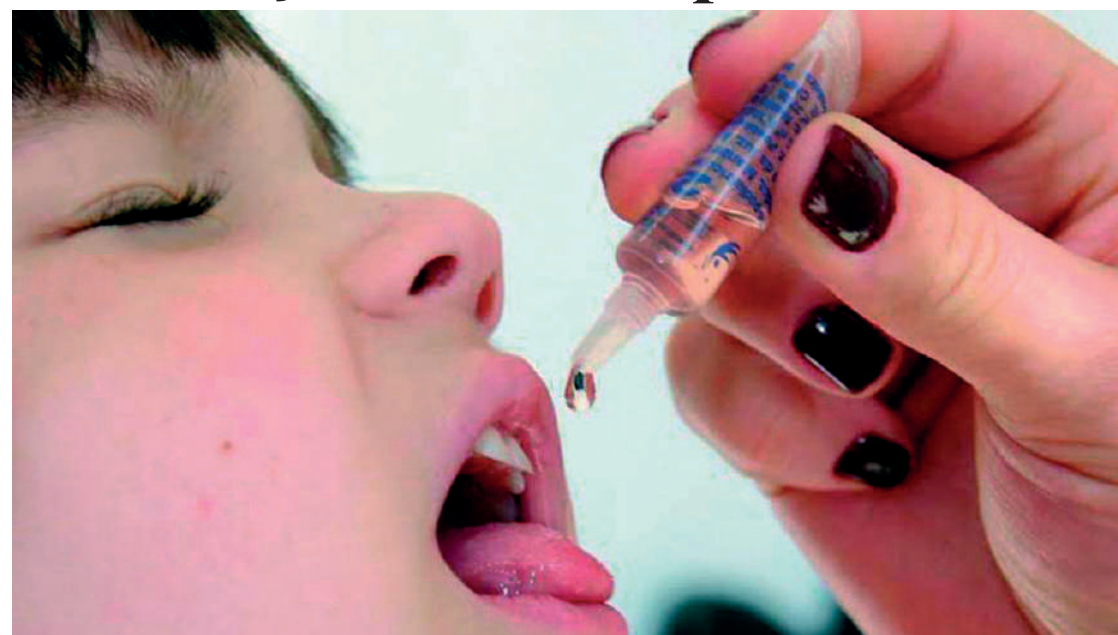
As vacinas estão disponíveis em todas as Unidades Básicas de Saúde (UBS) das 7h às 19h

A Prefeitura de São Paulo iniciou na segunda-feira (27), a campanha de vacinação contra a poliomielite para crianças menores de 5 anos de idade. Serão utilizadas as vacinas inativada poliomielite (VIP), para menores de 1 ano, e a oral poliomielite (VOP), conhecida como gotinha, para crianças entre 1 a menores de 5 anos, seguindo as diretrizes do Programa Nacional de Imunizações (PNI).