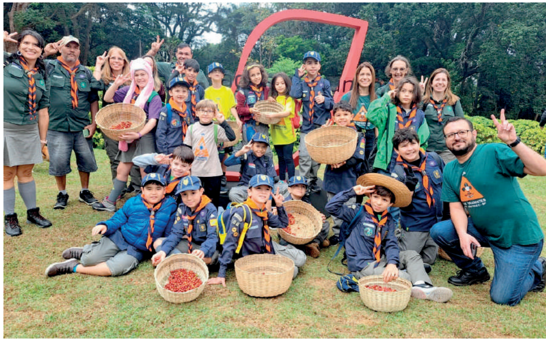
Mesmo com a queda de temperatura e mudança no tempo neste sábado (25), a 17ª edição da Colheita do Café, realizada pelo Instituto Biológico, foi um sucesso e reuniu dezenas de visitantes. PÁGINA 4