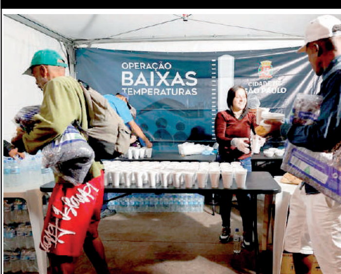
As tendas funcionam das 18 h às 0h e oferecem alimentos

Com a previsão de frio intenso nos próximos dias, a Prefeitura de São Paulo retomou a Operação Baixas Temperaturas (OBT), acionada sempre que os termômetros ou sensação térmica atingem 13°C ou menos. De acordo com o Centro de Gerenciamento de Emergências (CGE), a previsão é de que a chegada de uma frente fria provoca chuvas generalizadas, rajadas de vento e acentuado declínio das temperaturas nos próximos dias.