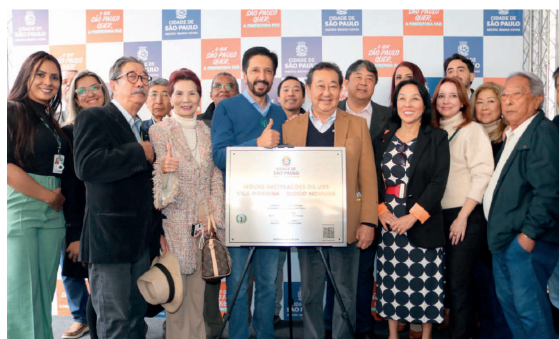
Novo endereço tem 1.305 m2 e a capacidade de realizar 4.544 atendimentos por mês

Segundo a Prefeitura, foram investidos R$ 6 milhões para a implantação do equipamento.