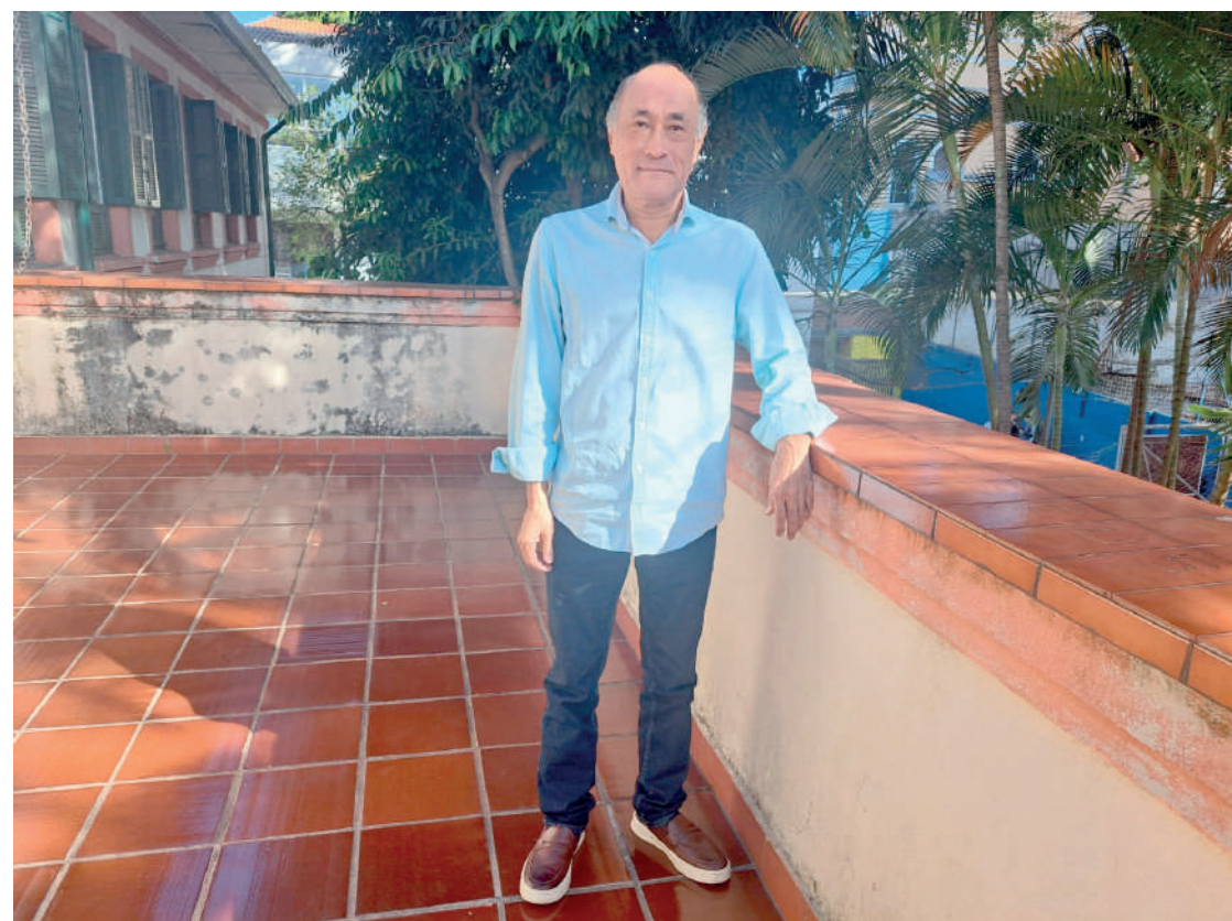
Novo comandante do bairro fala sobre lixos irregulares, segurança e o seu trabalho pelo bairro

“Eu estou chegando agora, não tenho as informações todas, mas estou me inteirando de tudo o que vai ser feito, mas a gente anda pelo Ipiranga e os grandes corredores já estão recapeados”, expressou ainda.