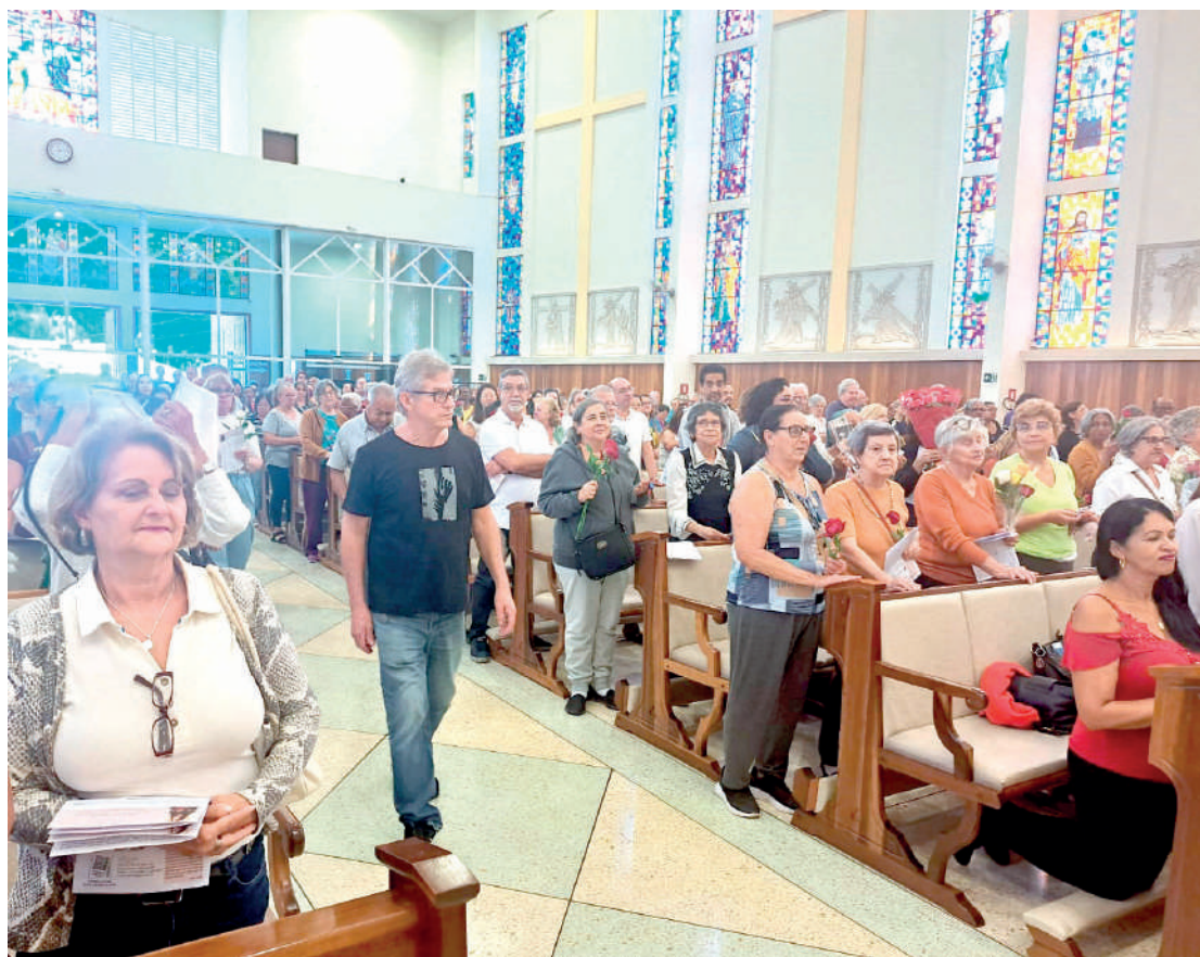
Milhares de fiéis compareceram à festa de Santa Rita de Cássia nesta quarta-feira (22), na Paróquia que leva o nome da santa em Mirandópolis, numa demonstração de fé católica. Esse está sendo o 64º festejo da igreja para celebrar o dia da Padroeira das Causas Impossíveis. PÁGINA 4