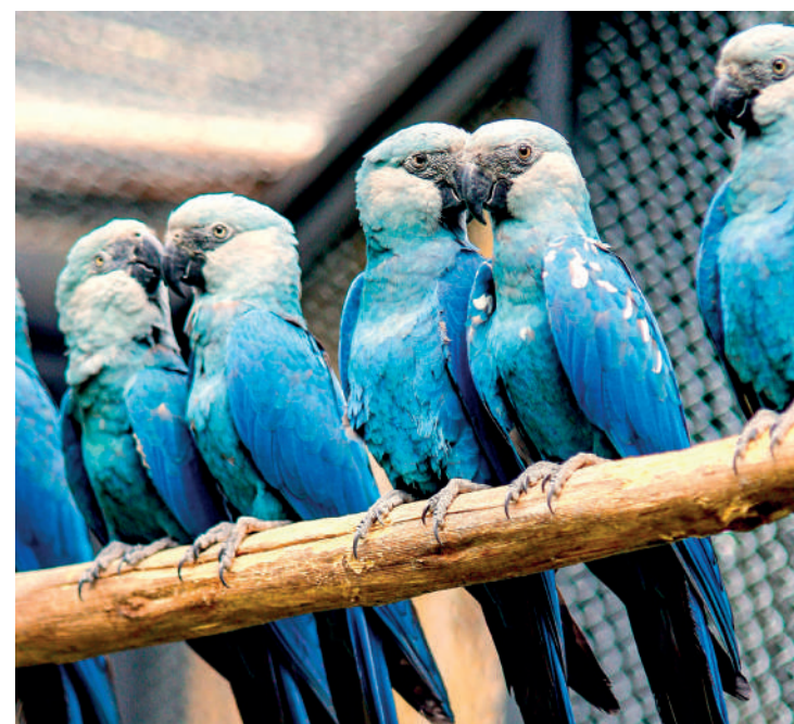
Novo espaço possui 900 metros e ambientes com espaço coberto

“Extinta na natureza” de acordo com a Lista Vermelha Global de Espécies Ameaçadas da União Internacional para a Conservação da Natureza - UICN e categorizada como “Criticamente em Perigo de Extinção” (CR) na Lista Brasileira Oficial de Espécies Ameaçadas de Extinção.