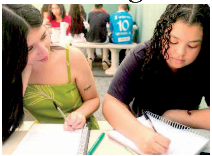
Cursos de inglês e mandarim serão apenas para alunos do EM

As aulas de Libras são abertas também a estudantes a partir do 7º ano do Ensino Fundamental, mas têm três semestres de duração. As aulas de português como língua estrangeira para estrangeiros estão disponíveis para estudantes a partir do 6º ano do Ensino Fundamental e são ministradas por um ano e meio.