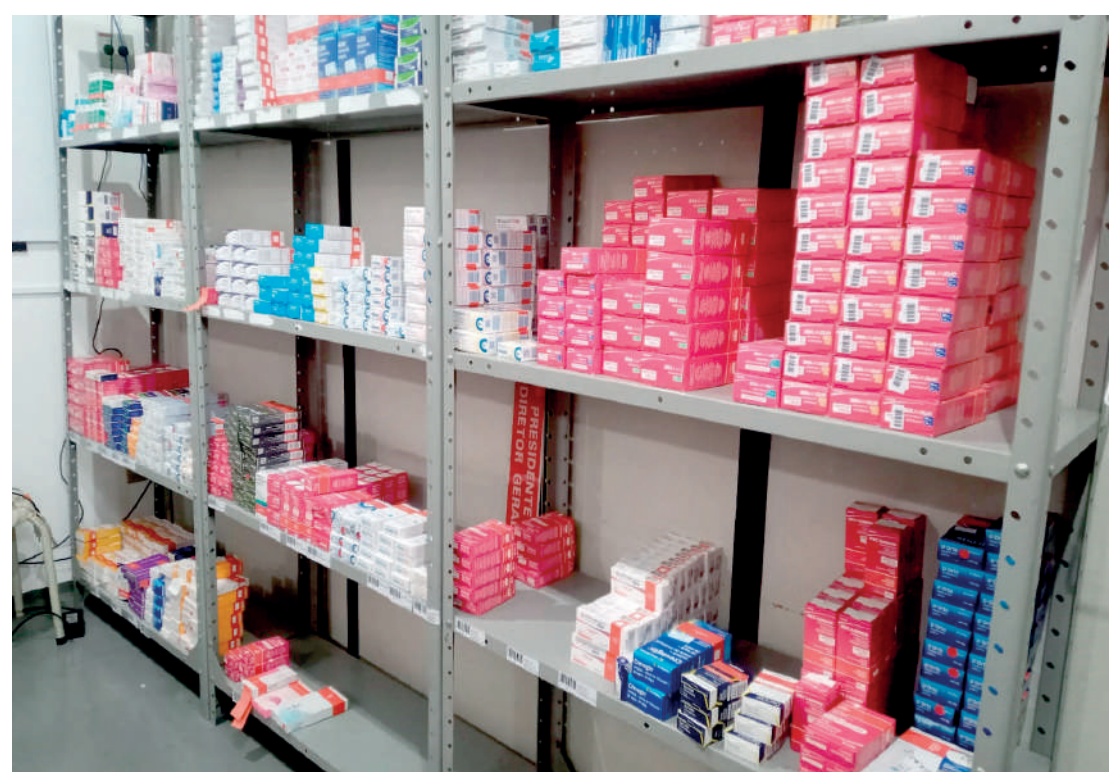
Farmácia popular da região recebeu a licença sanitária com festa e animação dos envolvidos

A Farmácia solidária fica na própria Obra Social Santa Edwiges, localizada na Rua Marquês de Maricá, 288, no Sacomã, próximo ao Santuário de Santa Edwiges.