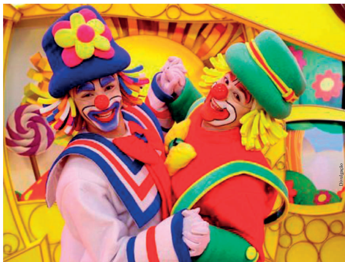
Uma parceria entre o maior zoológico do país e uma das mais conhecidas dupla de palhaços promete muita diversão para as crianças nos próximos dias. O visitante que adquirir um bilhete inteiro do Zoo SP, no site ou na bilheteria, receberá a meia entrada (crianças até 12 anos) para o Circo Show, no Tatuapé, zona leste da capital. Já o público que visitar o Patati Patatá Circo Show, no Tatuapé, ganha um bilhete meia entrada para o Zoo SP. PÁGINA 3