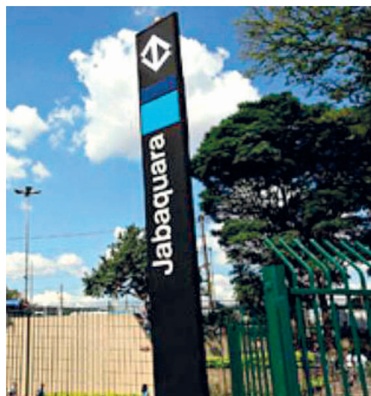
Um dos mais tradicionais bairros de São Paulo, o Jabaquara, está em festa para comemorar 60 anos. Para celebrar o aniversário, neste final de semana, programações especiais prometem agitar os moradores do bairro. No sábado (27), das 9h às 13h, acontecerá a Feira da Saúde, no Terminal Jabaquara, que fica na Rua dos Comerciantes, 126. PÁGINA 4