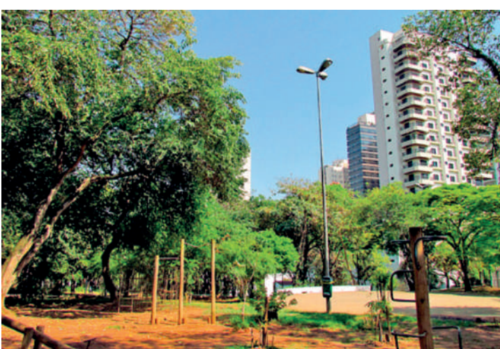
Praça Flávio Xavier de Toledo receberá as atrações o dia inteiro

O Portal do bairro na mesma rede também reagiu com palmas ao anúncio dos eventos que acontecerão no domingo. A festa contará com apoio da Subprefeitura do Ipiranga, Associação Comercial de São Paulo e importantes instituições da região, como Rotary Clube, por exemplo.