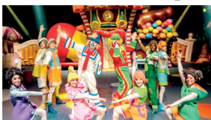
Ação acontece até 19/05 ou enquanto durarem os ingressos

O espetáculo “Vem Sonhar” conta a história de Rinaldini, um jovem que sempre quis ser mágico e um dia, ao desenhar seus personagens, deu vida aos seus melhores amigos: Patati e Patatá. O show conta com nú-