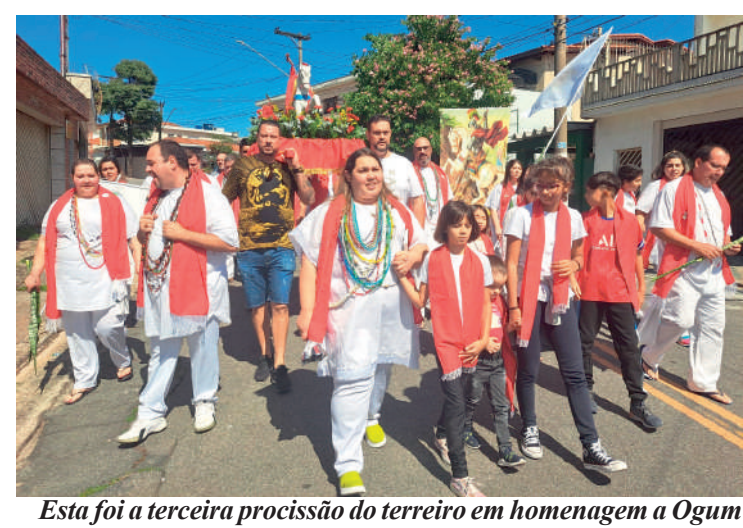
Esta foi a terceira procissão do terreiro em homenagem a Ogum

É de mostrar a Umbanda para as pessoas, de deixar um pouquinho na rua, na casa de cada um a proteção desse Orixá maravilhoso”, disse. “Ogum para mim é tudo. Quem me dá equilíbrio, força, me ajuda a vencer todas as batalhas que eu tenho na minha vida, quem enxuga minhas lágrimas, ele é tudo”, destacou. A Tenda Umbandista Caminhos de Aruanda fica na Rua Cavalheiro Frontini, 356, São João Clímaco, e as giras acontecem às sextas-feiras, 20h.