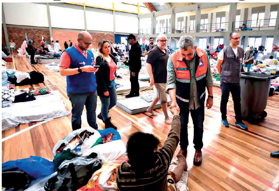
Casas abandonadas e até mesmo barcos usados para salvar vidas são alvo dos criminosos

Eduardo Leite lamentou que a situação climática tende a se agravar nos próximos dias. Uma frente fria que está se deslocando para o Rio Grande do Sul e isso deve provocar temporais generalizados no estado, em todas as regiões.