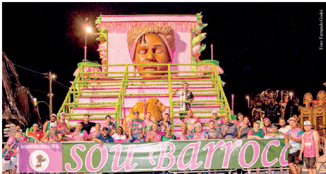
Desfile acontece depois do falecimento do presidente Borjão; agora quem assume é Cebolinha, seu filho

Confirmando sua presença no Grupo Especial ano passado, acumulando os mesmos números de pontos de 2022 (269,5) e mantendo-se na mesma posição – 10º lugar –, a Barroca Zona Sul homenageará os 50 anos de sua trajetória no Anhembi, na sexta-feira (9), sendo a segunda escola a desfilar.