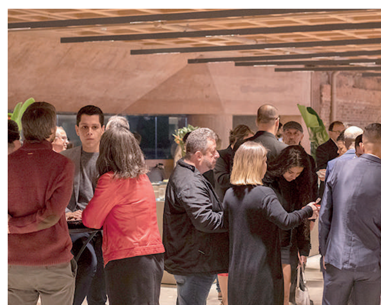
Toda quarta-feira, população pode visitar o Museu de graça

de USP (servidores, professores e alunos), guias de turismo credenciados, membros ativos do ICOM e servidores ativos da Polícia Militar, Polícia Civil e Polícia Técnico-Científica do estado de São Paulo e seus familiares (cônjuge ou companheira/o, filhos e menores tutelados ou sob guarda). Nesse caso, o policial deverá apresentar seu último holerite, acompanhado de documento de identificação. O benefício é determinado pela resolução SC-39, de 15 de julho de 2010, do Governo do Estado de São Paulo.