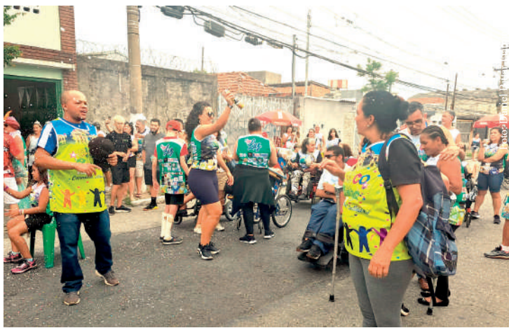
Bloco do Onze na Vila Carioca levou centenas de pessoas às ruas

No próximo final de semana, de Carnaval, o bairro receberá mais blocos regionais que prometem agitar a folia de quem não for viajar no feriado. Sábado (10), desfilarão pelas ruas do bairro os blocos “Cavaleiros de Doçu” e “Me Viram no Ipiranga”.