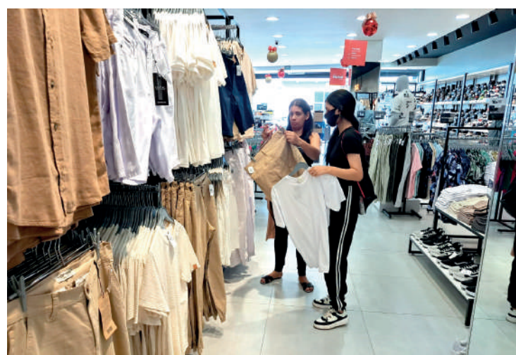
Há 15 anos na av. Santa Catarina, loja registra bom movimento