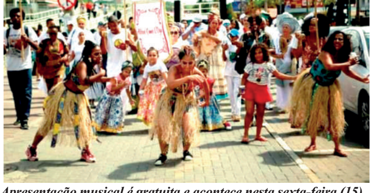
Apresentação musical é gratuita e acontece nesta sexta-feira (15)

Acontecerá no Sesc Vila Mariana, na sexta-feira (15), das 18h30 às 19h30, uma apresentação musical gratuita do "Acafro Afóxé Omo L'Oyá", que possui em sua história a união da cultura africana com a cultura popular brasileira, fazendo um trabalho de preservação, fortalecimento, permanência e continuidade ancestral. "Afoxé Omó' L'Oyá" nasceu dentro do Terreiro de Candomblé, Ilê Egbé Alaketú Oyá Alagbará, no ano de 2015, na cidade de Franco da Rocha, em São Paulo. Omó L'Oyá, homenageia a orixá Oyá, a grande divindade guerreira, dona dos ventos, impetuosa, forte, audaciosa, corajosa, e que possui um olhar mais justo e igualitário para toda a sociedade. O Sesc Vila Mariana fica na rua Pelotas, 141.