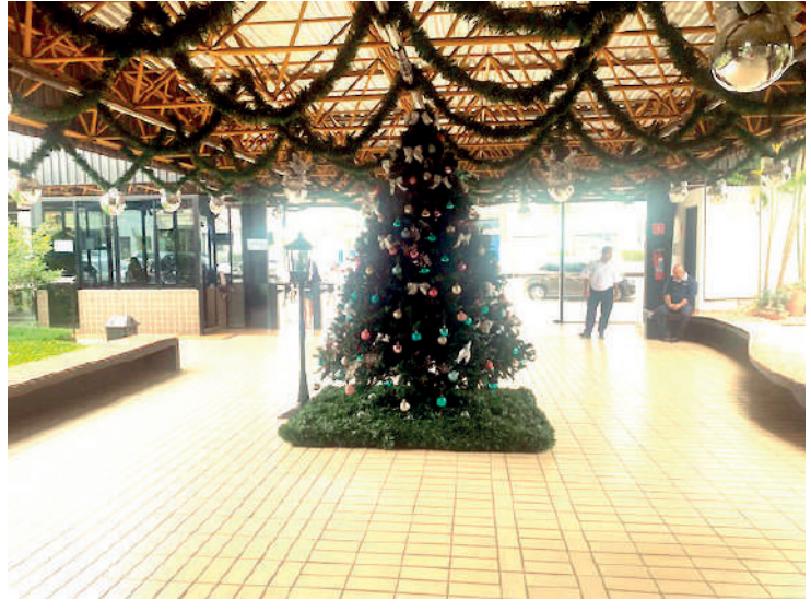
Clima de Natal chega ao Clube; o presépio tem um significado muito importante para os católicos e foi criado há 800 anos, em 1223

O clima de natal chegou ao Clube Atlético Ypiranga (CAY). Uma enorme árvore de Natal e um presépio foram montados na entrada principal do clube, trazendo o simbolismo do natal aos 6,5 mil sócios do Vovô da Colina. O presépio tem um significado todo especial para os católicos. Esse ano, em 24 de dezembro, o mundo comemora 800 anos que, em 1223, em Greccio, na Itália, nascia a tradição de se fazer presépio. Por trás dessa iniciativa