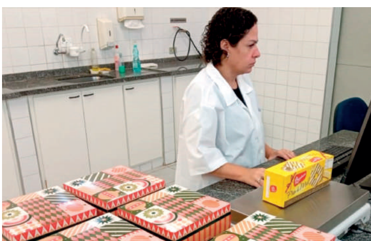
Operação “Pente Fino” avaliou 220 produtos como peru e pernil

No Estado, a operação “Pente Fino” avaliou 220 produtos (aves e carnes típicas das ceias de fim de ano, como peru, chester, codorna, tender, presunto, pernil, lombo, pescados e carnes em geral, além de cereais, pães, panetones, bolos, frutas in natura e secas), dos