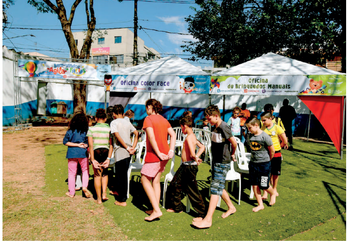
Podem participar crianças desde a primeira infância até adolescentes de 12 a 17 anos

Nos meses de férias, é importante manter a garotada em atividade, de preferência com muita diversão. Por isso, a Secretaria Municipal de Esportes e Lazer da Prefeitura de São Paulo, promove a partir do dia 22 de dezembro mais uma etapa do programa Agita + Férias, com opções de esporte e lazer para crianças e adolescentes se distraírem e se exercitarem. As atividades são oferecidas de sexta-feira a domingo, das 10h às 17h, em dez Centros Esportivos das Zonas Norte, Leste, Oeste, Sul e Central. São brinquedos infláveis, espaço gourmet kids, atividades recreativas de brincadeira de rua, espaço recreativo baby e oficinas diversas: pintura de rosto, brinquedos manuais, esporte e dança, entre outras atrações. Para os mais radicais e crescidinhos, vai ter pista de skate e pump track em alguns locais. O Agita + Férias segue o calendário oficial de férias escolares da rede municipal da Prefeitura de São Paulo e tem como foco a primeira infância,