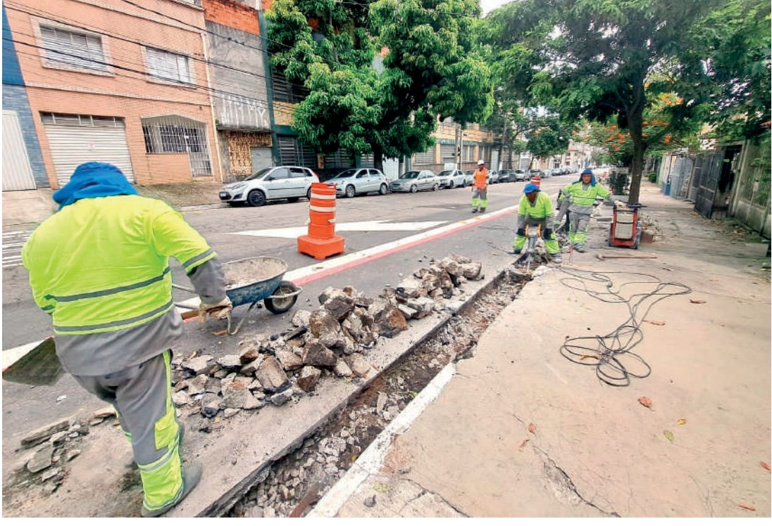
Obras já foram feitas entre a Lucas Obes e Almirante Lobo e agora seguem até a General Lecor

Em setembro, deste ano, a equipe de reportagem do Ipiranga News noticiou sobre as placas na rua Agostinho