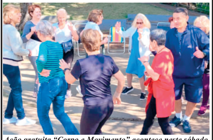
Ação gratuita "Corpo e Movimento" acontece neste sábado

Os frequentadores do Sesc Ipiranga que gostam de vivenciar práticas corporais poderão participar, neste sábado (16), das 14h às 15h, da ação gratuita "Corpo e Movimento", que acontecerá no quintal da unidade, levando danças, capoeira, expressões corporais e artes marciais para aqueles que desejam participar. As atividades envolvem movimentos que trabalham força, flexibilidade, ritmo, respiração, concentração, e que colaboram para o autoconhecimento. Já na sexta-feira (15), das 13h30 às 15h, acontecerá, na Sala 1 do Sesc Ipiranga, a oficina de artes visuais gra-