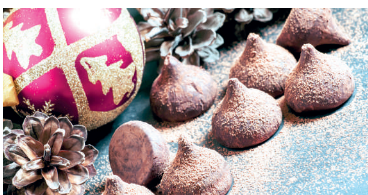
As trufas são típicas dessa época do ano e não podem faltar

Bolo de Nozes com Passas e Canela Ingredientes: 6 ovos; 125 gramas de nozes raladas ou bem picadinhas; 60 gramas de passas; 300 gramas de açúcar; 250 gramas de manteiga sem sal, em temperatura ambiente; 350 gramas de farinha de trigo; 1 colher (chá) de fermento em pó; ½ colher (café) de canela em pó. Preparo: Bata a manteiga com o açúcar até obter um creme liso, e sem parar de bater adicione 2 ovos inteiros batendo por cerca de mais 2 minutos. Adicione 4 gemas e bata bem. Bata as 4 claras em neve firme, junto ao preparado alternadamente com a farinha, previamente misturada com as nozes raladas, as passas, fermento e canela e envolva muito bem. Coloque o preparado numa forma de buraco no meio, previamente untada com manteiga e polvilhada de farinha. Leve ao forno quente à 180°C por cerca de mais ou menos 45 minutos.