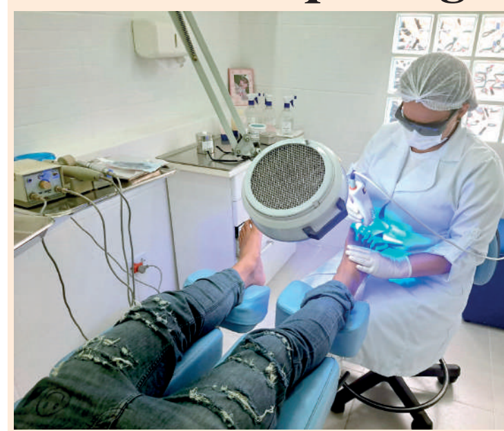
Barsotti Pés está localizada na rua Brigadeiro Jordão, 717

A equipe da Barsotti Pés é composta por podólogas altamente qualificadas, formadas pelo renomado SENAC, garantindo aos clientes um atendimento de alta qualidade e profissionalismo. A profissão de podólogo desempenha um papel crucial na saúde dos pés e os cuidados oferecidos pela Barsotti Pés vão além da estética, abrangendo tratamentos para calos, calosidades, unhas encravadas, Onicomiose (micose de unha), Onicoortoses, verrugas plantares, laserterapia e reflexologia. Esses serviços visam não apenas