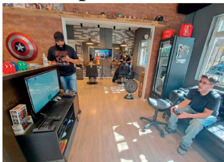
Ambiente conta com bebidas, bonecos Geek e video game

Fruto do excelente trabalho e da qualidade do atendimento, os 15 clientes da barbearia no primeiro mês de atuação, hoje, transformaram-se em aproximadamente 400. E a meta, para o próximo ano é continuar em constante crescimento, com novos projetos que estão por vir e ampliação do local.