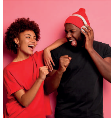
Época de renovar os objetivos

Ao se comprometer com essas mudanças, você verá que, sem perceber, elas se tornarão