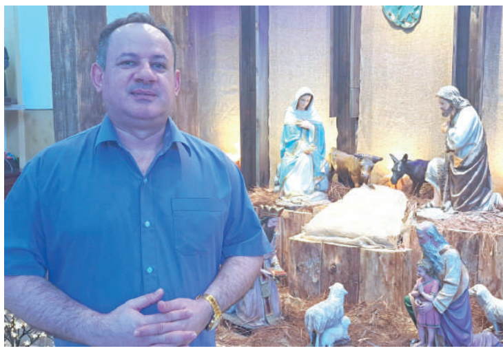
Frei ficou 11 anos na Paróquia e agora segue para Caruaru

Foi ele, também, quem fundou a Capela de São Peregrino, que hoje, é o segundo Padroeiro da Paróquia. Inclusive, ele foi o pioneiro a solicitar e conseguir um veículo paroquial para que pudesse realizar suas diversas missões