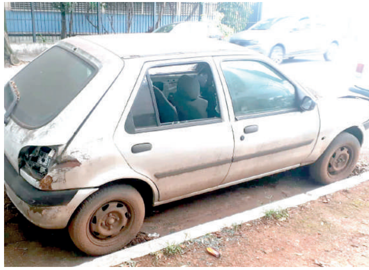
Fiesta está no mesmo local na Manifesto há quatro meses e meio

Em nota, enviada no dia 11 de dezembro, a subprefeitura Ipiranga informou que “a Coordenadoria de Planejamento e Desenvolvimento Urbano (CPDU), da subprefeitura Ipiranga, adesivou o Fiesta Street prata fabricado em 2002, no dia 13 de novembro de 2023. No entanto, ao fazer o levantamento, foi identificado que o veículo tem restri-