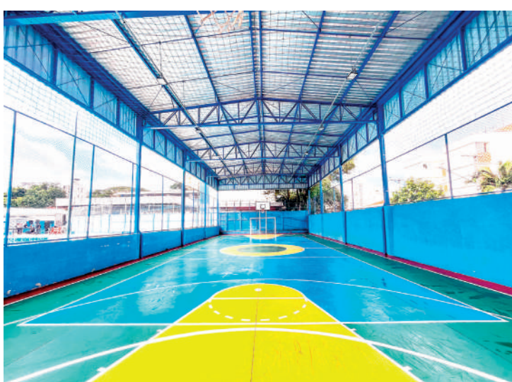
Quadra poliesportiva também foi reformada e está pronta para uso

de ter um equipamento público oferecendo diversas atividades esportivas e de lazer em seu bairro. “A gente tem dificuldade e ter um equipamento como este é uma bênção. Já começo a fazer as aulas de hidroginástica em janeiro”, contou.