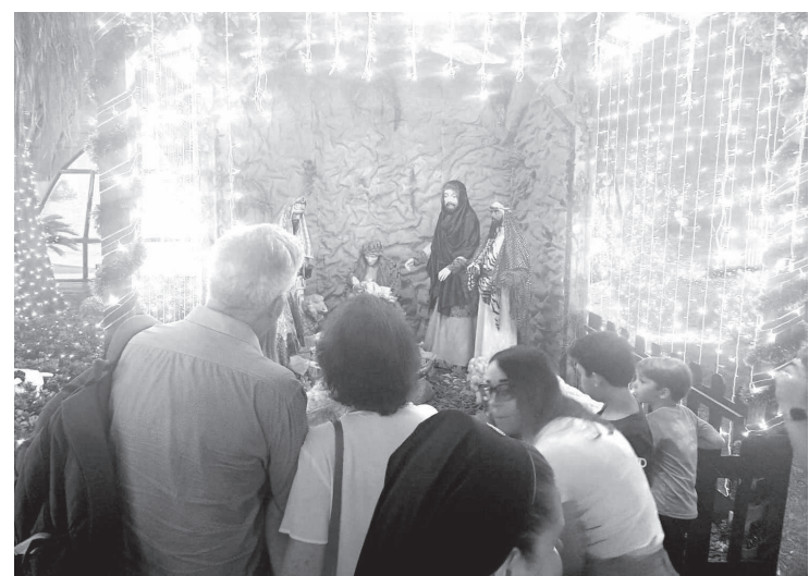
O presépio ficará na rua Domingos de Moraes até 5 de janeiro

A exibição acontece na entrada principal do colégio, localizado na Rua Domingos de Moraes, 2565, na Vila Mariana, e é aberta ao público e