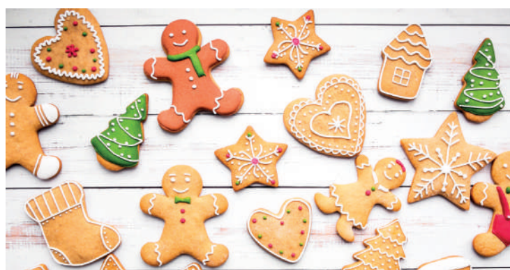
Biscoito é uma das tradições de Natal que não pode faltar

enfarinhada, abra a massa com um rolo até que fique com 0,5 cm de espessura. Corte a massa com cortadores de formatos variados. Unte duas ou mais assadeiras grandes com manteiga e polvilhe com farinha. Distribua os biscoitos nas assadeiras, deixando uma margem de 2 cm entre eles. Leve ao forno preaquecido e deixe assar por 10 minutos. Retire do forno e deixe esfriar. Quando os biscoitos ficarem firmes, retire-os com a ajuda de uma espátula. Enfeite os biscoitos com glacê. Conserve num recipiente fechado, em local seco e arejado. Variação: Se preferir diminua a quantidade de gengibre em pó e acrescente canela e cravo da índia em pó. Cubra a bolacha inteira com glacê e salpique confeitos coloridos, enquanto o glacê ainda estiver molhado.