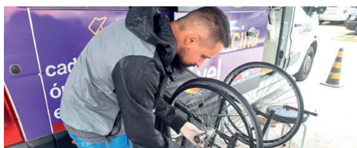
Ação é realizada 2 vezes por mês, mas em dezembro será só dia 12

Para participar da ação, o interessado deve agendar pelo telefone 3913-4071, apresentar o cartão do SUS e um documento com foto. O Hospital Flávio Gianotti fica na R. Xavier de Almeida, 210, no Ipiranga.