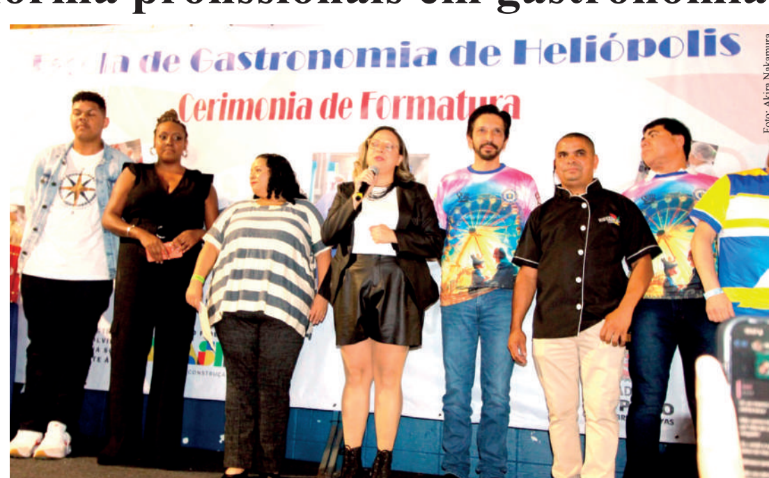
Solenidade de formatura teve shows da banda Fala Mansa e da Escola de Samba Imperador do Ipiranga

O curso é oferecido para população de baixa renda, desempregados e em situação de vulnerabilidade social com idade a partir de 18 anos e é oferecido um conteúdo programático com aulas práticas de Gastronomia e aulas teó-