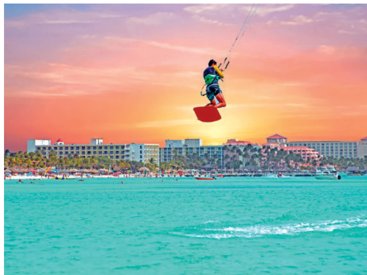
Ilhas são um paraíso carregado de hospitalidade calorosa

A Jamaica, evoca a palavra "paraíso" com sua música, mar azul e drinques incríveis. Com temperaturas agradáveis entre 27 e 32 graus o ano inteiro, é o destino preferido de casais em busca de um casamento exótico.