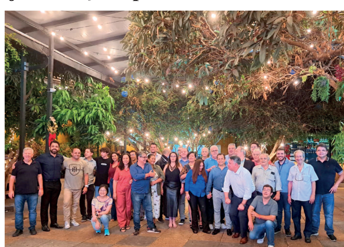
Encontro aconteceu no Quintal do Espeto, no Tatuapé, com os representantes dos jornais de bairro

“O Franco Montoro dizia uma coisa: as pessoas não