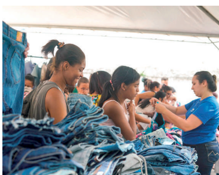
100% da verba é revertida para a manutenção do Instituto

Os organizadores ressaltaram que ressaltar que não serão aceitas devoluções ou trocas de mercadorias adquiridas.