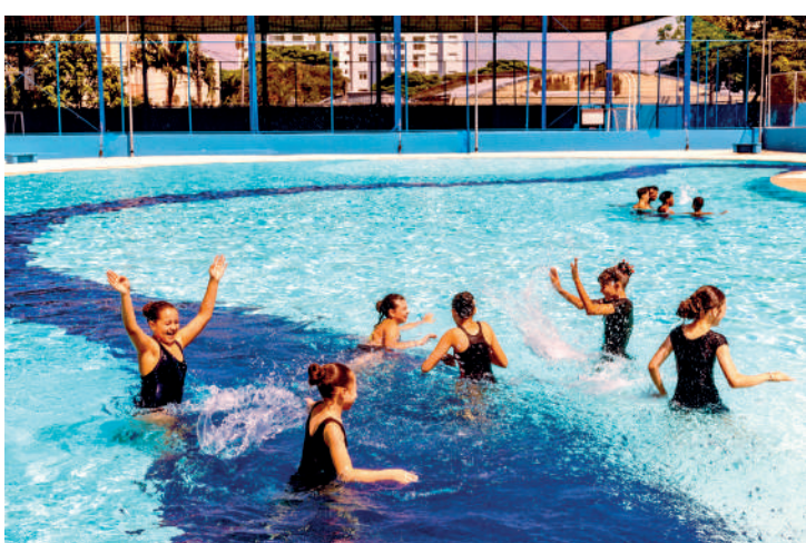
Piscina teve troca de azulejos, escadas, decks, filtros e corrimãos