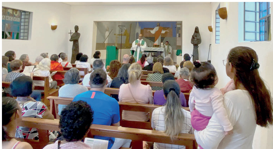
Capela, que ficou lotada, passou por obras de restauro, realizadas desde abril deste ano. Esta foi a segunda vez que o local foi restaurado. A primeira foi em 2006

"Gostaria de agradecer imensamente à comunidade da Capela que me recebeu e é uma grande honra para mim ter feito esse trabalho aqui. Agradeço, também, toda a confiança dos Dominicanos por ter confiado aqui nesse grande trabalho. É uma honra muito grande, des-