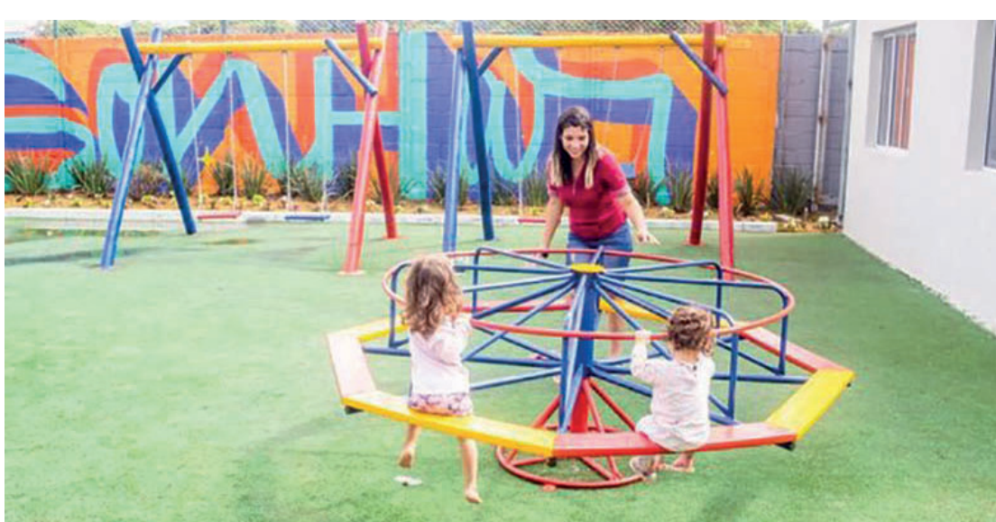
Vila Reencontro terá, ainda, espaços de lazer e diversão para crianças das famílias moradoras

Já no segundo eixo, serão oferecidas moradias subsidiadas para aqueles que não possuem renda suficiente, nas seguintes modalidades: locação social,