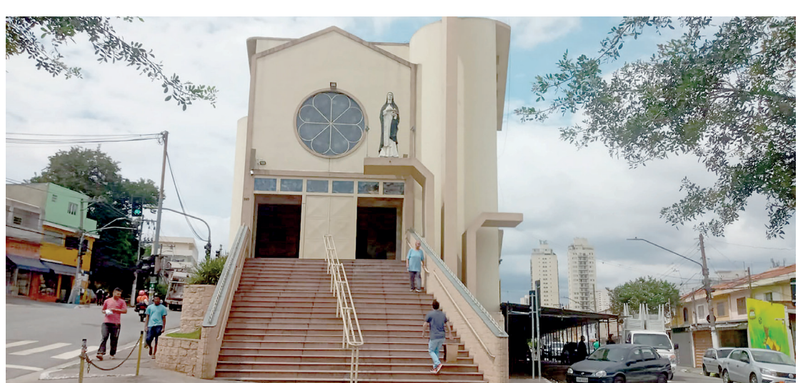
No dia 16 a Paróquia irá receber uma programação especial. A quermesse acontece é o dia 29

No (16), dia de Santa Edwiges, a Paróquia receberá uma programação especial, com Missas durante o dia inteiro (07h; 9h; 11h; 13h; 15h; 16:30h; 18h e 19:30h), além