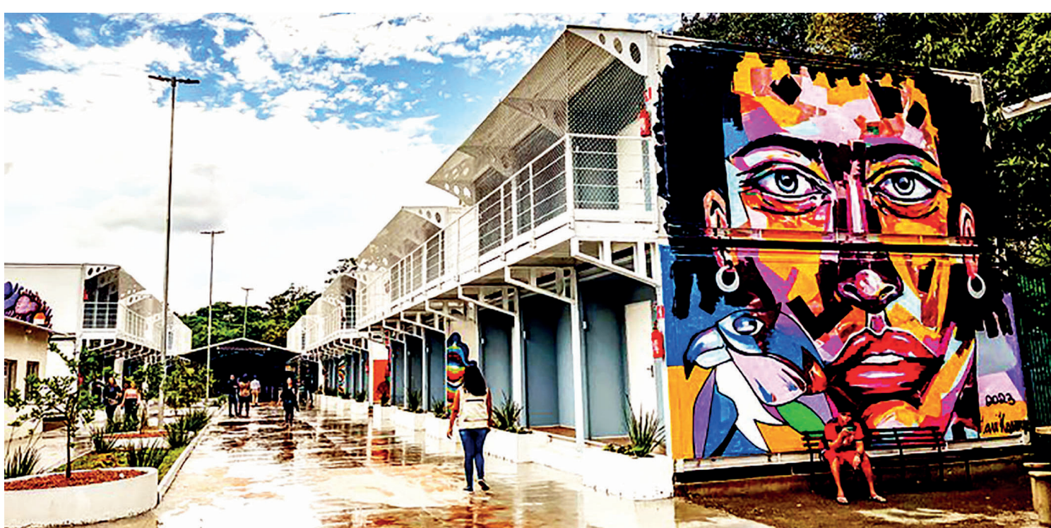
Vila será destinada à 100 famílias em situação de rua. O programa é focado na conquista da autonomia dos moradores do local

A secretária de Direitos Humanos e Cidadania, Soninha Francine, também falou sobre as ações da administração municipal na defesa e atenção aos mais vulneráveis, como a distribuição de 15 mil refeições prontas em vários locais da cidade, incluindo favelas e a região central, para pessoas vivendo em situação de rua ou em condições muito difíceis. “Também são distribuídas diariamente de 7 mil a 10 mil cestas básicas, tudo isso para combater a fome, mas queremos ir além disso e trabalhar sempre para a promoção da